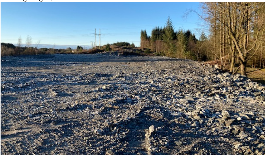
Terrengingrep øvre del