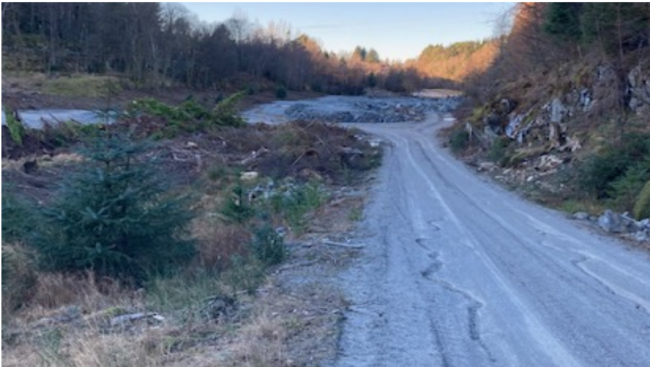
Terrengingrep nedre del