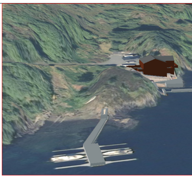
3D kart. Sett mot nordvest