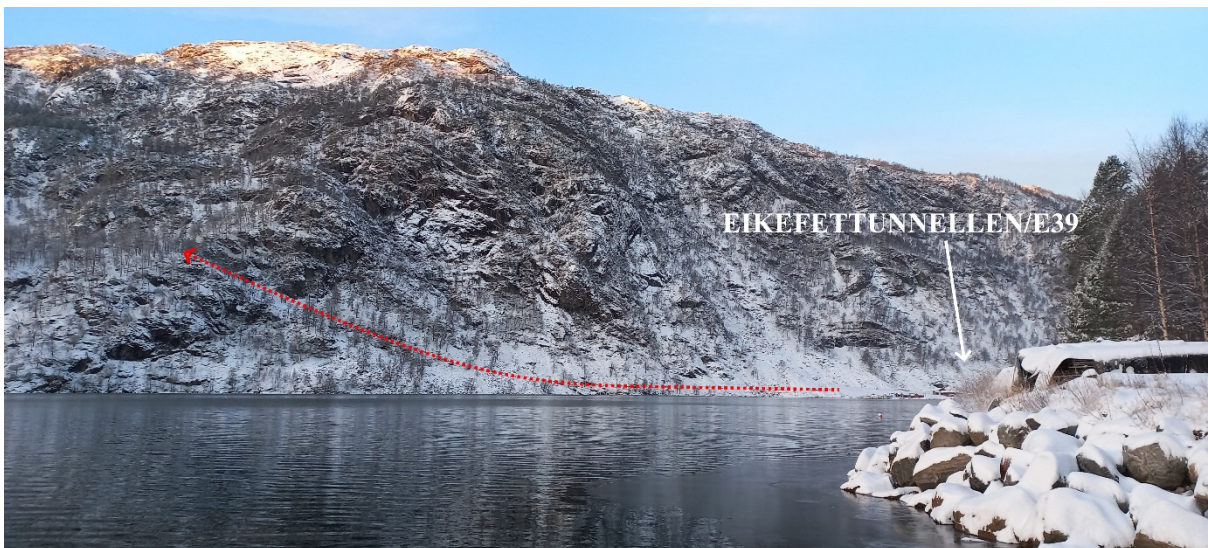
Fig. 2. Omtrentleg trasé for driftevegen synt som raud stripla line.

Slike søknadar skal vurderast etter naturmangfaldslova §§ 8-12 jf. § 7. Ut frå det som kjem fram ovanfor finn vi at kravet om kunnskapsgrunnlaget i naturmangfaldslova § 8 er godt nok til å fatte vedtak. Vidare er «føre-var» prinsippet teke i vare med det kunnskapsgrunnlaget som ligg føre, slik intensjonane i naturmangfaldslova § 9 føreset. Vi kan heller ikkje sjå at den samla byrda for økosystemet er nemneverdig lidande jf. naturmangfaldslova § 10. Veggen er avgrensa i omfang og gjev heller ikkje, etter kommunen sitt syn, nemneverdige ulemper og gjev slik sett best mogleg lokalisering jf. naturmangfaldslova §§ 11 og 12.