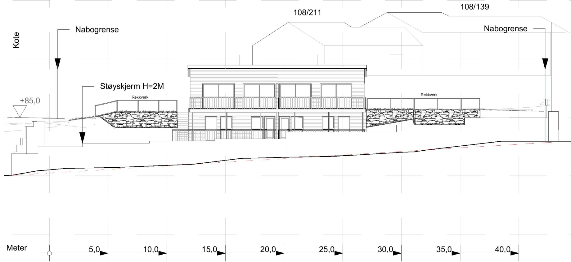
Profil A 1:200