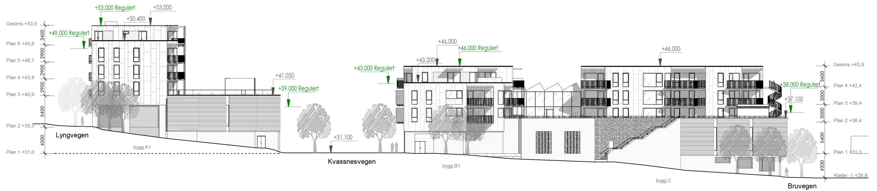
Fasade øst 1:400