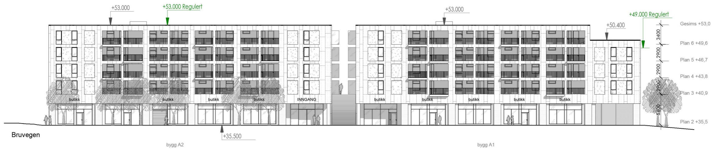
Fasade nord bygg A 1:400