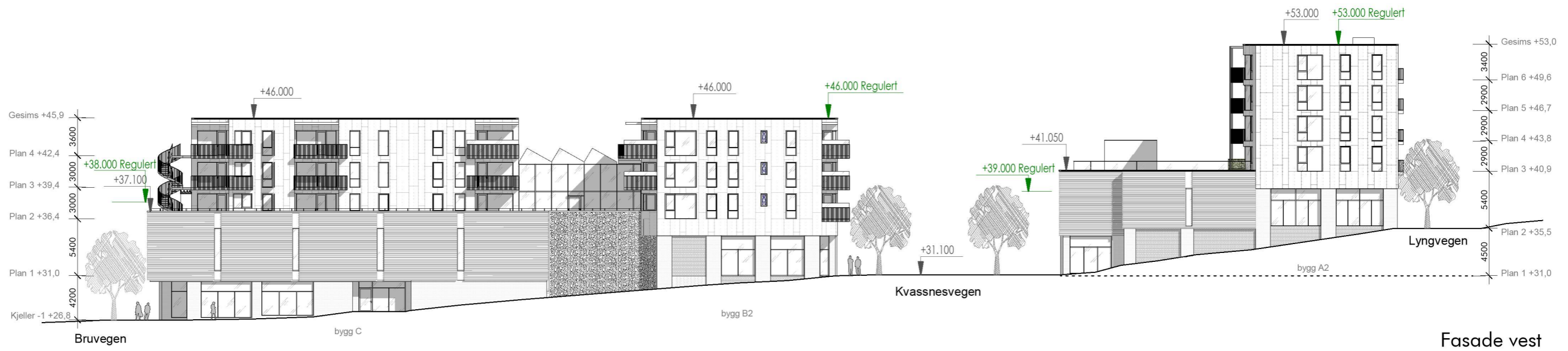
Fasade vest 1:400