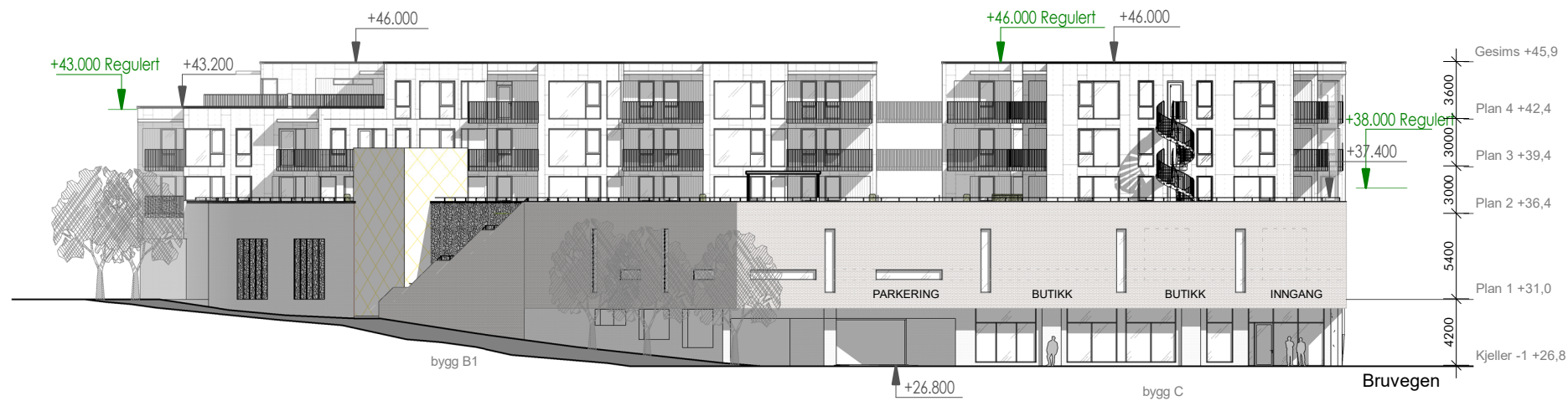
Fasade sør bygg B/C 1:400