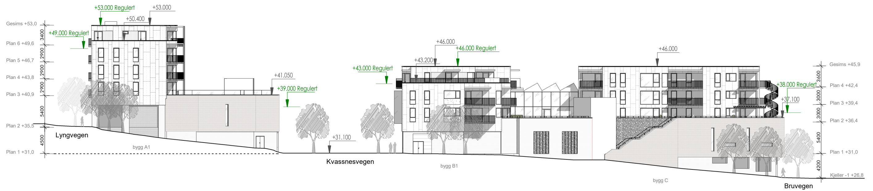
Fasade øst 1:400