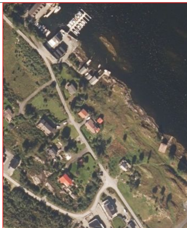
Figur 2 Ortofoto 2020