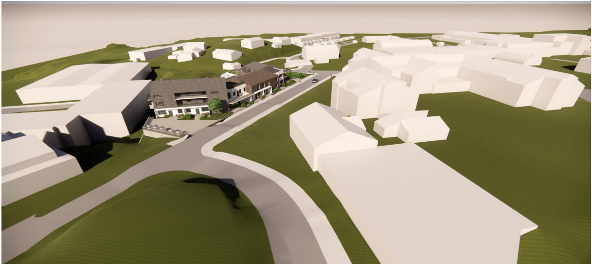
Planforslaget med variasjon i struktur og byggjehøgder tilpassa Kvassnesvegen og nabobygg

Planlagt prosjekt har ein variert gesimshøgd og trappast ned mot vest. Sikringa av desse høgdene gjev ein dynamikk og rytme som er betre terrengtilpassa og betre visuelt for dei som ferdast i Kvassnesvegen.