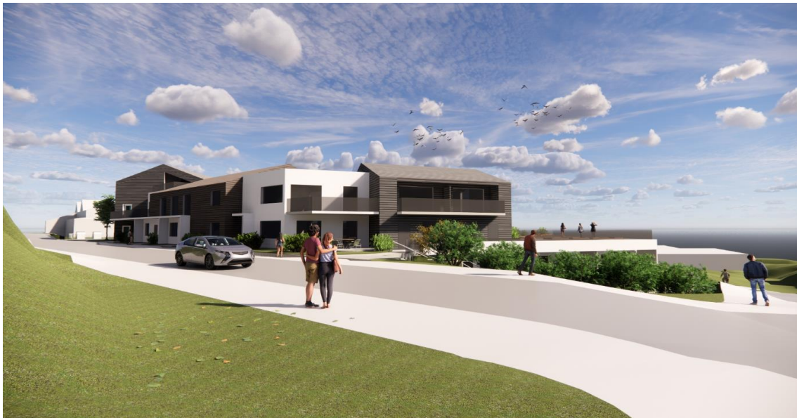
Planforslaget med variasjon i takform, høgder og fasadekledning