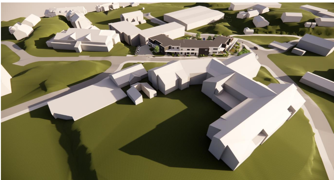
Alternativ med flatt tak