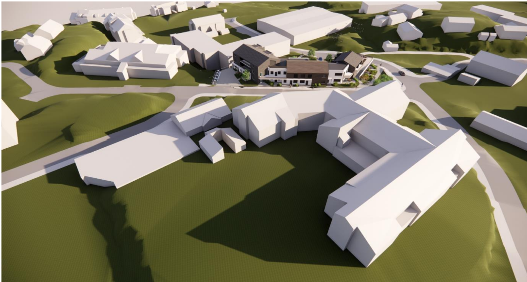
Planforslaget inspirert av takform og fotavtrykk til nabobygg

Planforslaget som fremmast er tilpassa staden. Prosjektet er inspirert av takform og fotavtrykk til nabobygg. Ein variasjon i byggjehøgdar, og materialbruk i fasadane vil bryte med verknaden av høgden i prosjektet på ein effektiv måte. Den varierte strukturen i byggjehøgdar støttes og i kvalitetsprogrammet for Knarvik.