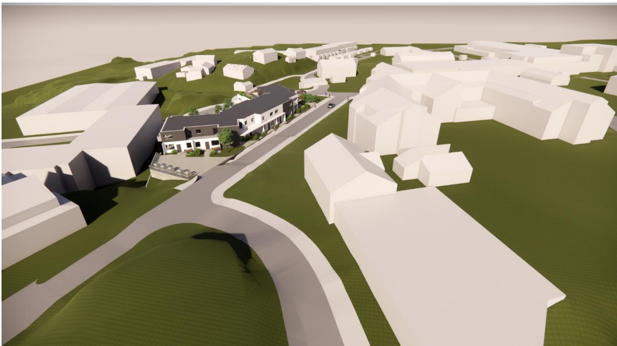
Alternativ med flatt tak

Nabobygget Kvassnesvegen 61 lengre inn i vegen ligg på eit lågare terreng enn vårt bygg, men har tilnærma same kote for gesims og møne som vårt bygg.