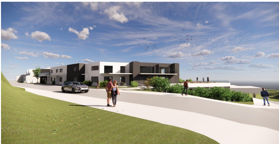
Alternativ med flatt tak