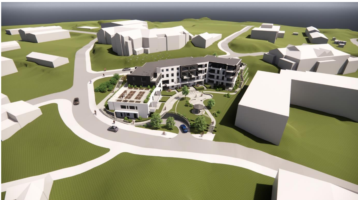
Alternativ med flatt tak