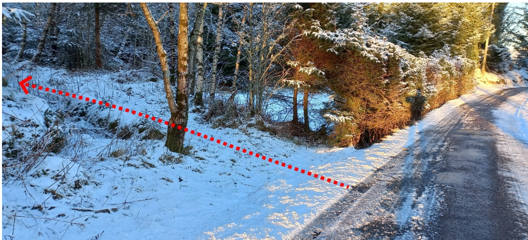
Fig. 3. Vegen vil ta av frå den kommunale vegen om lag her.