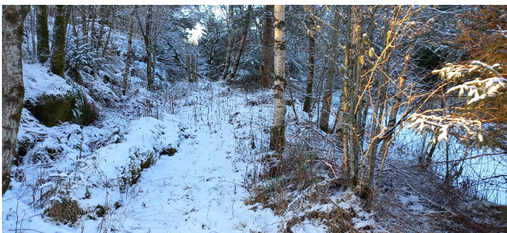
Fig. 4. Frå den kommunale vegen (der fotografen står, vil vegen liggje på denne hilla. Fulldyrka jord synt i fig. 2 til høgre.