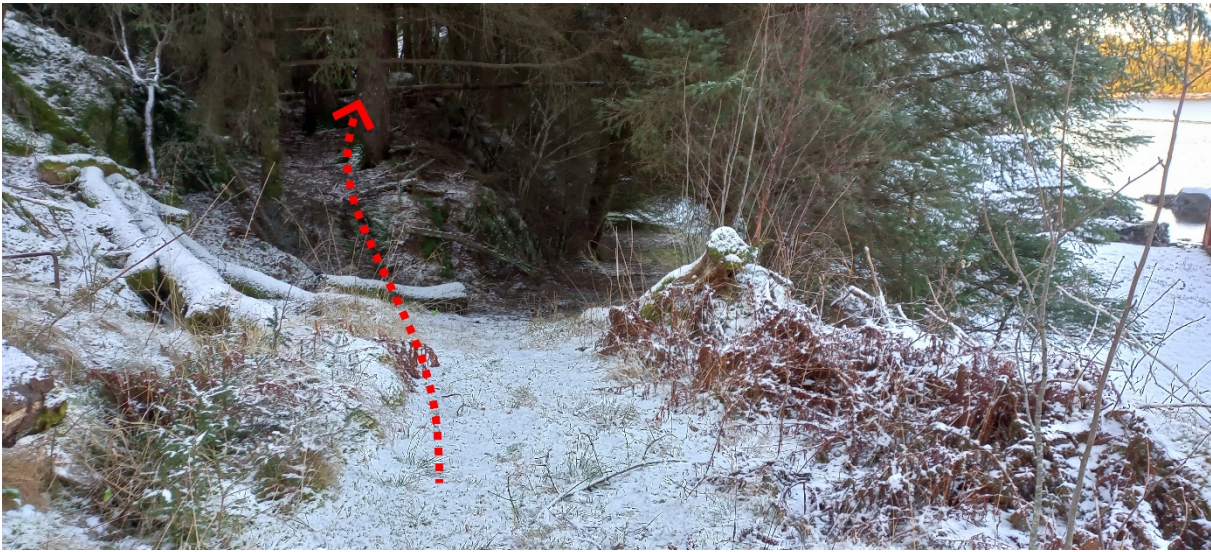
Fig. 5. Vidare innover vil den «klyve opp» ei stutt men bratt «kneik».