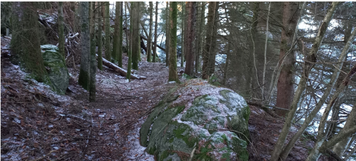
Fig. 6. Traséen går vidare på ei flate inn der granskogen er. Sluttpunktet er lengst vekk i biletet der det ligg ei gran på tvers.