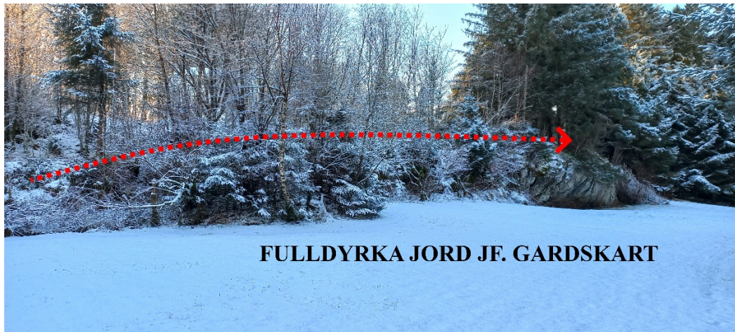
Fig. 2. Vegen vil gå om lag slik. Den vil liggje oppå ei «fjellhulle» rett sørvest for den fulldyrka jorda.

Veganlegget vert lagt på fast fjell parallelt med og på vestsida av den fulldyrka jord,