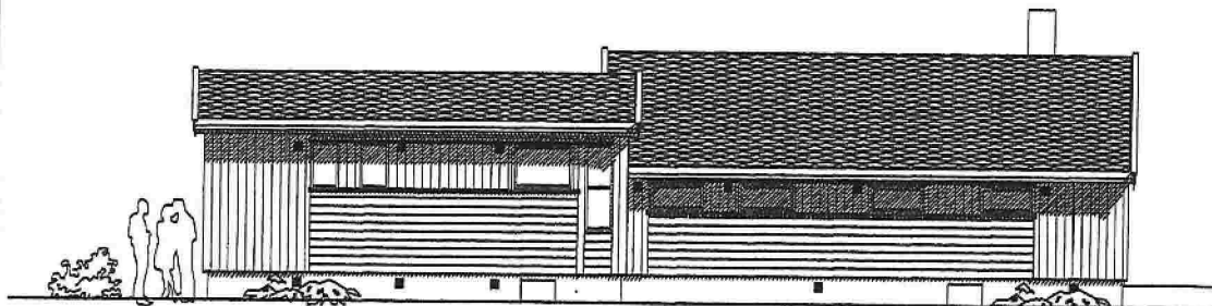
TLBYGG FASADE MOT NORDØST