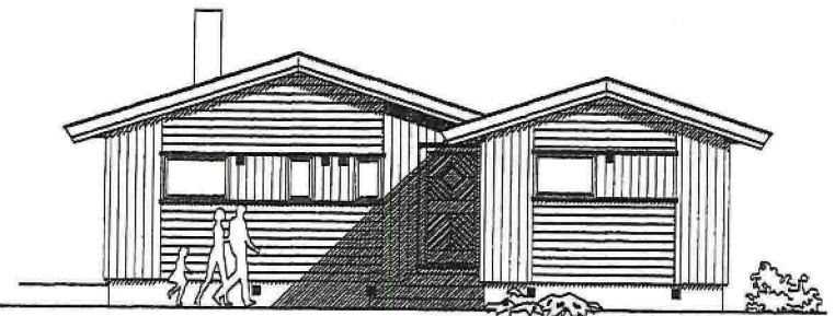
EKSISTERENDE DEL Justert Inngang på eksist. del TLBYGG FASADE MOT SØRØST