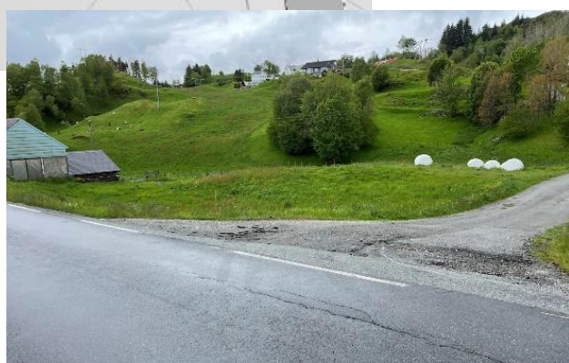
Bilde tatt nord-vest for avkjørselen