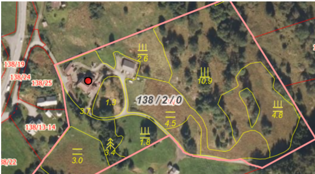
Figur 1 Flyfoto frå 2020. det ser ut som mykje av arealet ikkje var bruk