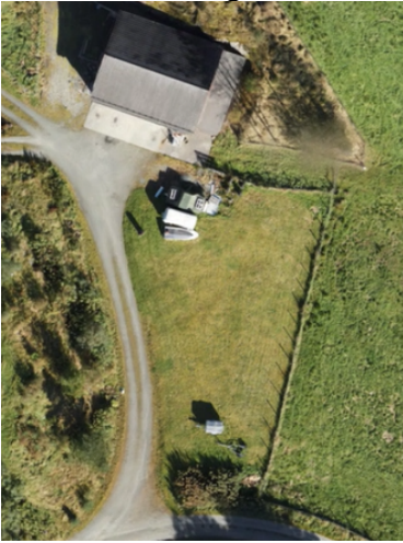
Figur 4 Er dette arealet egentleg ein del av hagen, og difor skulle vore tatt ut som fulldyrka areal