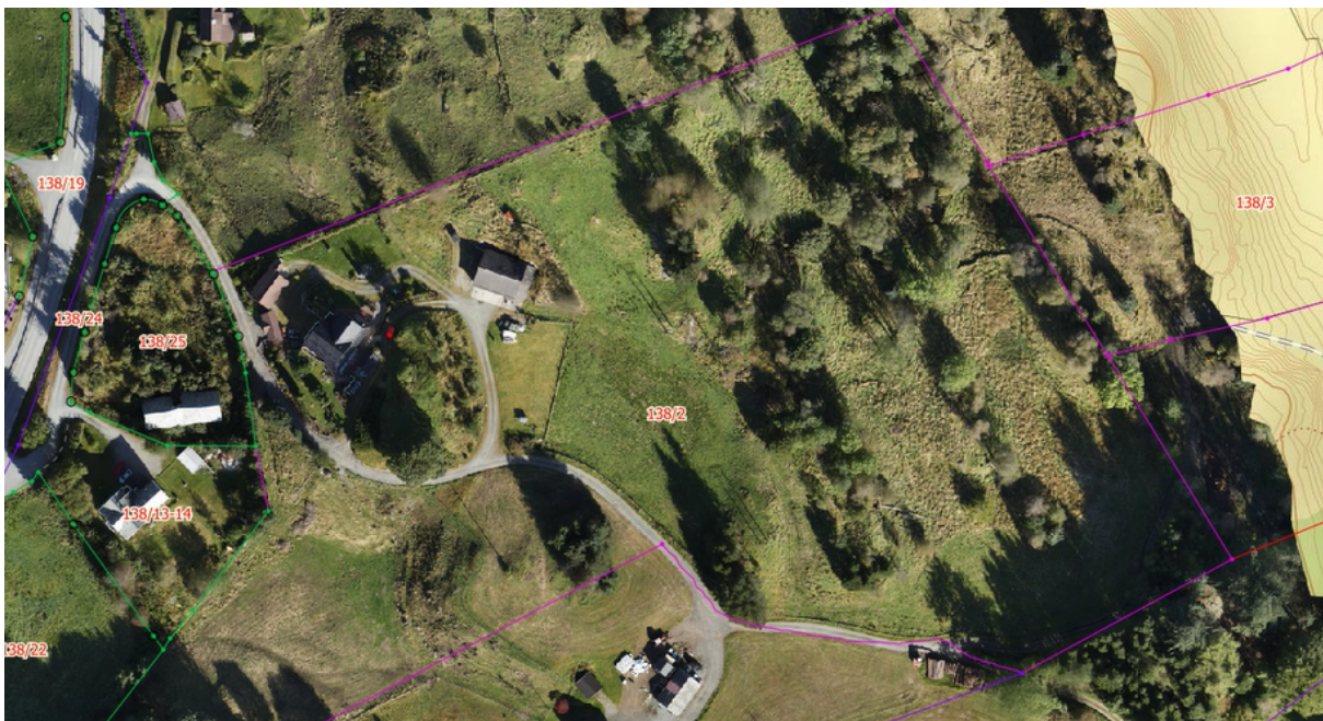
Figur 2 På dronefilm frå 2022 ser det ut som alt arealet er komen i drift att. Indikator -grønfarge på gras/vegetasjon