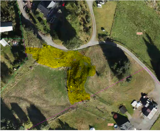
Figur 3 Areal farga med gult står som skog i kartet. Bør sjekka om det fyller krav til innmarksbeite og eventuelt endra AR 5