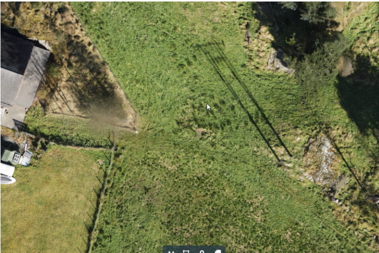
Figur 5 Ein del tuer med ugras - bør ha fokus på ugraskamp

Med vennleg helsing Alver kommune, Landbruk