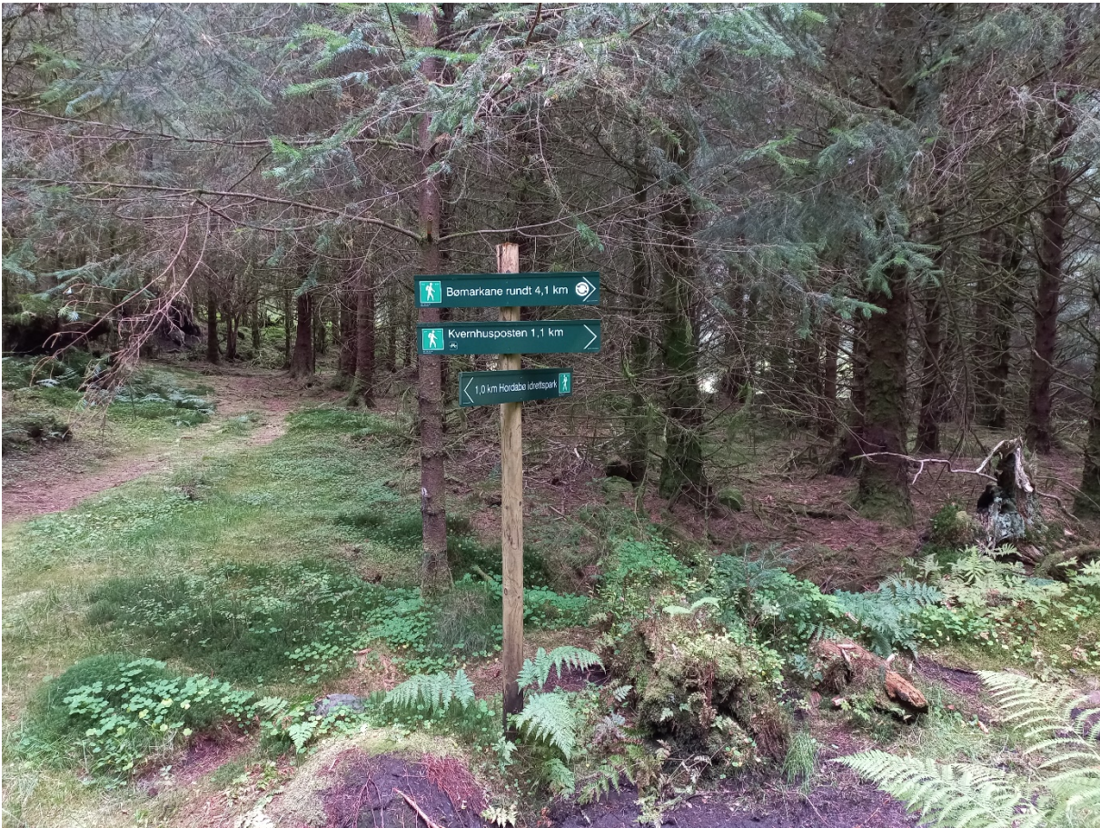
Fig. 4. Vegen skal liggje i eit område der det er ein del etablerte turstiar. Dette gjeld særleg i vestre del av vegtraséen.