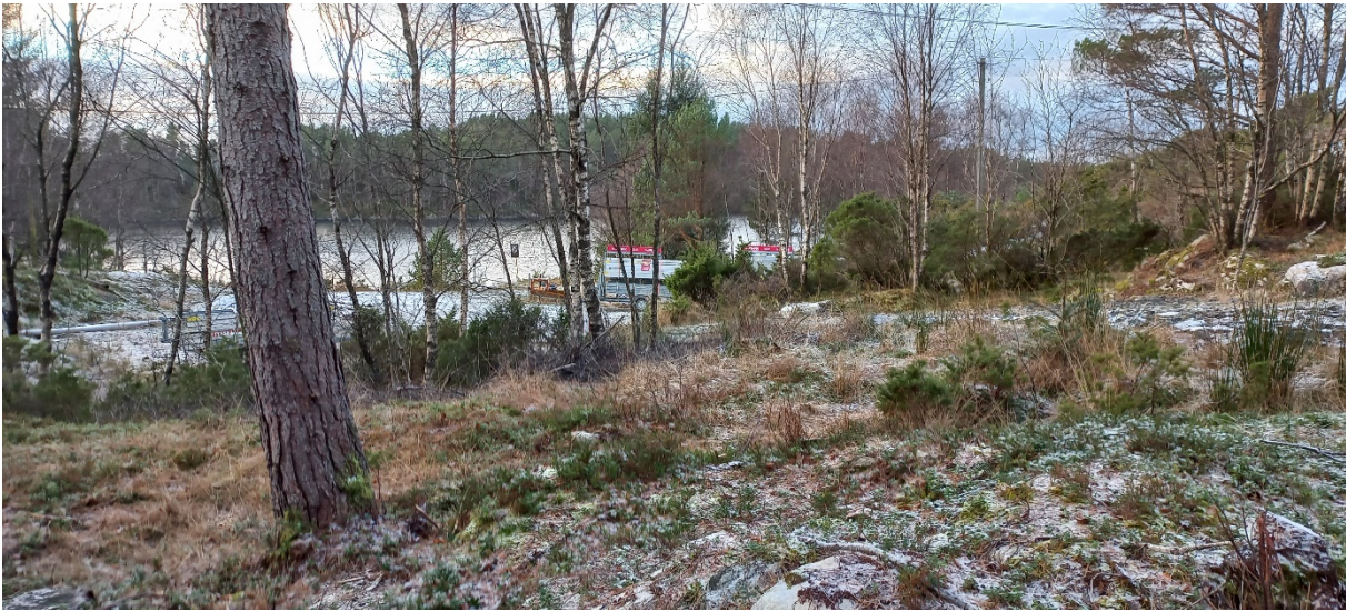
Fig. 2. ...og kome ned i dette området der p-plassen til fritidsbustadane.