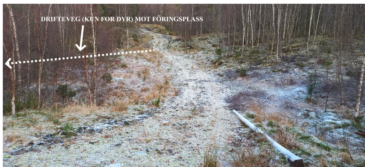
Fig. 1. Vegen skal byggjast om lag der den stripla lina går.