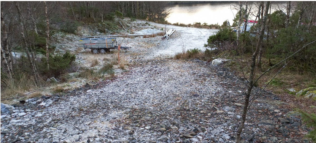
Fig. 3. Vegen skal kome inn frå venstre og føringsplassen vert liggjande frå om lag der hengaren er plassert og mot venstre i biletet.

Prinsippa i §§ 8-12 i naturmangfaldslova er lagt til grunn ved vurdering av vedtaket. Det er lagt særleg vekt på berekraftig bruk og vern av naturmangfald der den samla belastninga for økosystemet vert vurdert både på staden, men og i ein større samanheng. Kommunen har mellom anna søkt i naturbasen (via gardskart) og artsdatabanken. Det er ikkje gjort funn i traséen eller området i nærleiken.