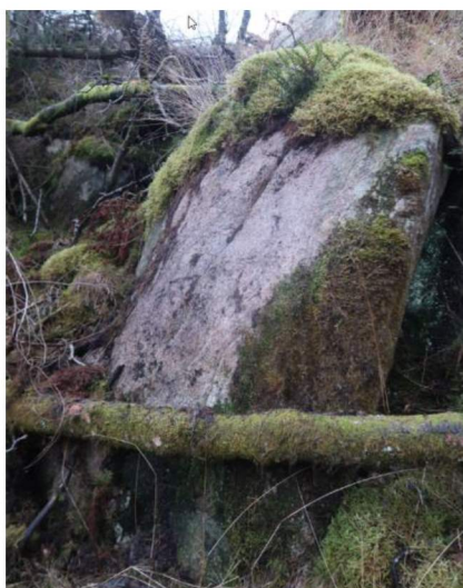
Bilde 3. To løse blokker i skråningen mot øst som vurderes som stabile.

Dersom det skal foretas sprengning på tomtene som gir skjæringer over ca. 2,0 m så skal bergskjæringene vurderes av firma med bergteknisk kompetanse for å vurdere behov for sikring. Sprengning kan endre stabilitetsforholdene i berget og gi fare for nedfall. Se også kapittel 6.