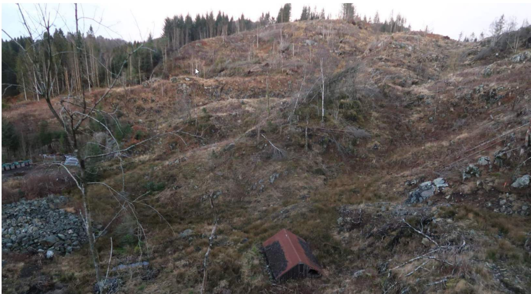
Bilde 1. Typisk terreng sentralt i planområdet. Bildet er tatt mot nordvest.

Planområdet ligger 45-105 moh. Terrenget i og rundt planområdet er småkupert med mindre bekkedaler og rygger, se bilde 1. Sentralt i planområdet er det en forsenkning i terrenget hvor det meste av overflatevannet fra nord og øst renner ned mot. Bortsett fra noen helt små loddrette bergskrenter (<5,0 m) er det det meste av terrenget under 45°. I øst er det bergskråninger opp imot 70° (bilde 2).