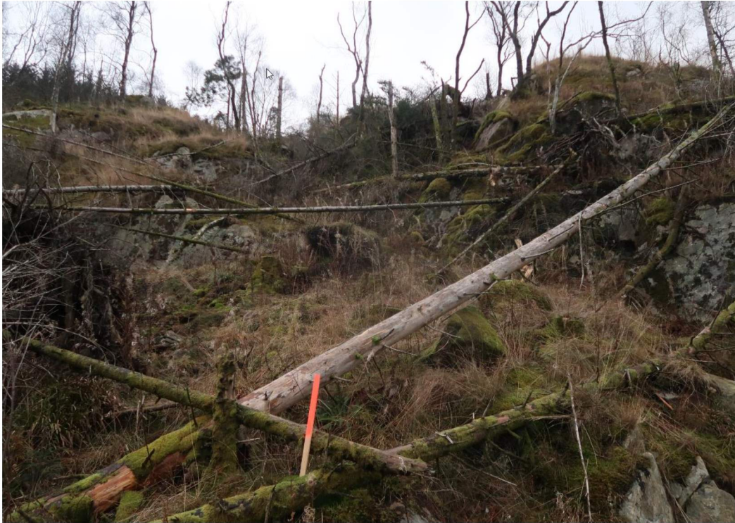
Bilde 2. Skråningen i øst med bratthet opp imot 70°. Bildet er tatt mot øst.