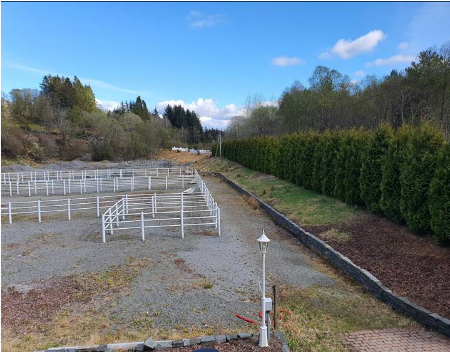
Bildet er tatt vår 2022. Bildet viser utforming av innhegning. Bildet viser også at det fortsatt pågår arbeider ifmb realiseringen av tillatelsen fra 2009.