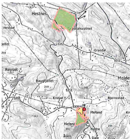
Fig. 2. Tiltaket ligg på den nordlege teigen som syner her.