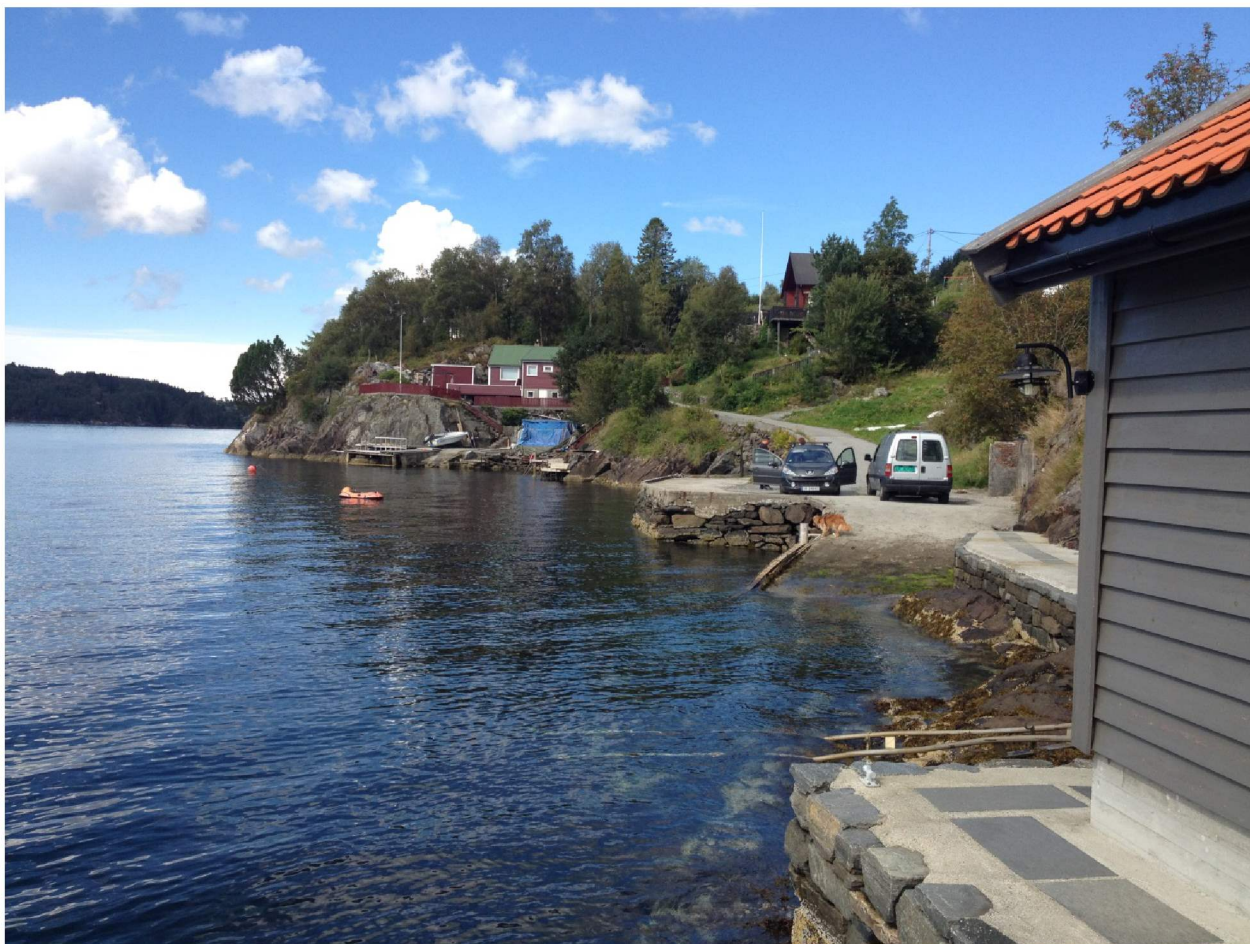
Figur 4: Nappevika, eksisterende slipp og kai midt i bildet

Som tidligere nevnt så vil tiltaket ikke skape varige inngrep av betydning, siden småbåtanlegget er reversibelt og parkeringsplassen er liten tett på veg og bebyggelse. Avstanden til området avsatt til tråling i kommuneplanens arealdel er så stor at vi ikke ser konfliktpunkter i forbindelse med den aktiviteten (se mørkeblått område i figur 1).