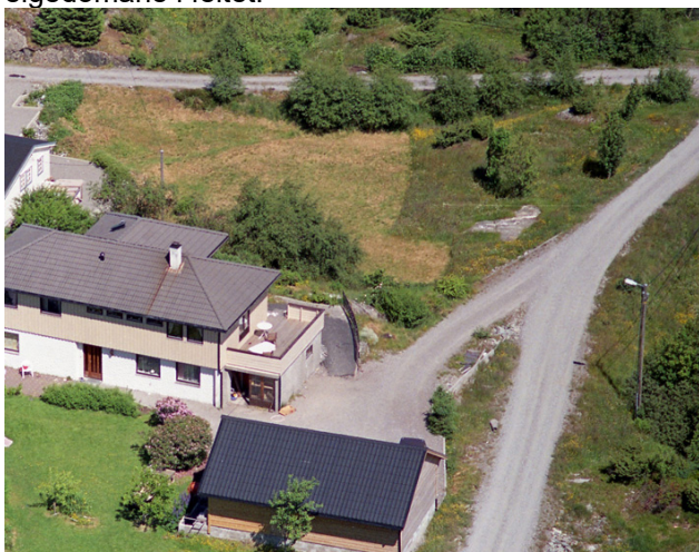
Figur 3 Flybilete frå 1982-84. Omsøkt veg til høgre.

Søkjar hevdar at vegen vart bygd før arealet vart sett av til LNF formål i kommuneplan for Lindås. (Tidlegare generalplan). Etter det administrasjonen finn vart første generalplanen for Lindås vedteken 15.05.1983 og godkjent av Miljøverndepartementet 23.04.1985. I gamle flybilete teke i tidsrommet 1982-1984 viser vegen. Administrasjonen finn derfor at vilkåret i læra om at vegen må vera bygd før arealet vart sett av til LNF formål er stetta. Arealet har heile tida vore brukt som tilkomstveg til eigedomane i feltet.