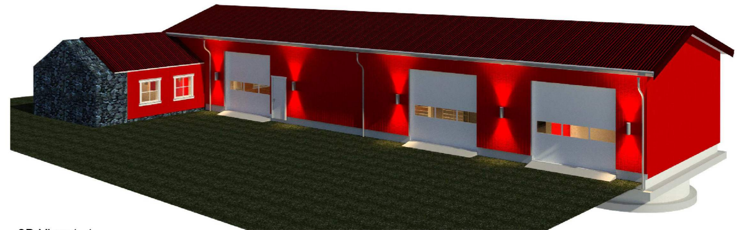
3D View 1_1 1 : 1

NB! Alle mål henviser til ferdig innvendig vegg.