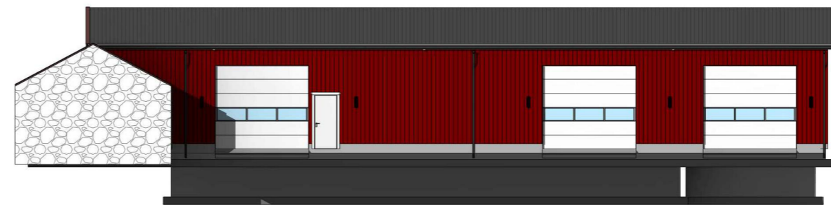
Fasade 4 1 : 100