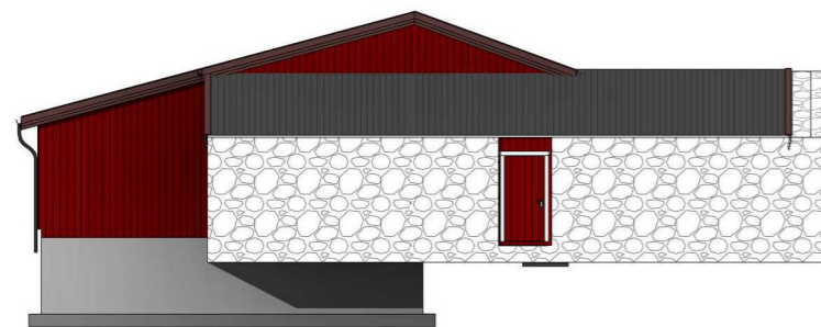
Fasade 3 1 : 100