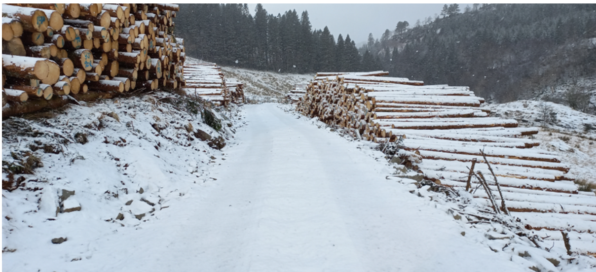
Fig. 2. Velteplassen er alt teken i bruk då hogsten er godt i gang.