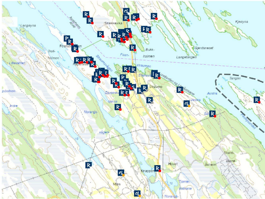
Figur 2. Arkeologiske lokaliteter i området, vist med rune R.

registrering for å få oppfylt undersøkingsplikta etter § 9 i kulturminnelova. Synfaringa vil bli gjort så raskt som råd.