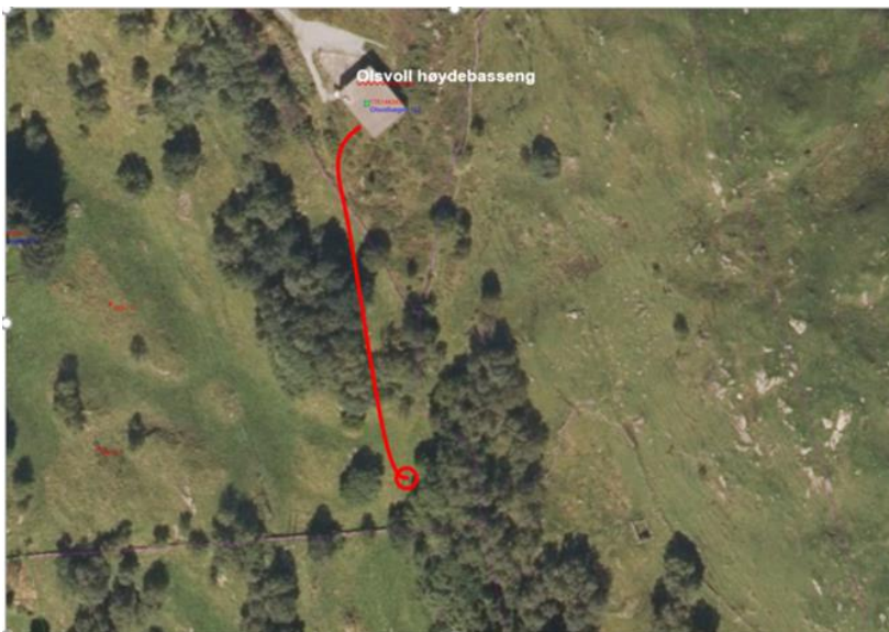
Figur 2: Oversikt over traseen.