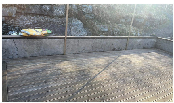
BILDER AV DAGENS ADKOMST-SITUASJON/ ADKOMST-TERRASSE