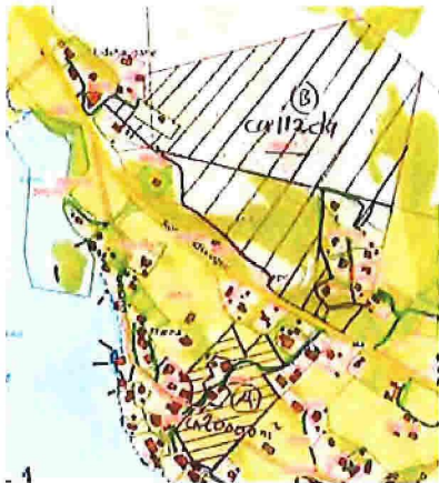
Bilde 1 -Teig A og B

Teig B. Om lag 112 daa skog/utmark Teig c: Om lag 75 daa skog i Oneset