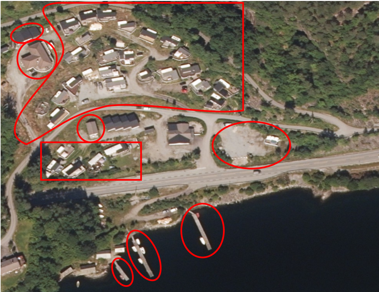
Områder med ulovlege tiltak markert i rødt