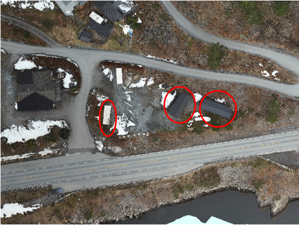
3 Modular på hjul plassert etter siste flyfoto frå 2020

plassering av modulane ettersom det er byggegrenser mot veg og sjø på staden som ikkje er overheldt.