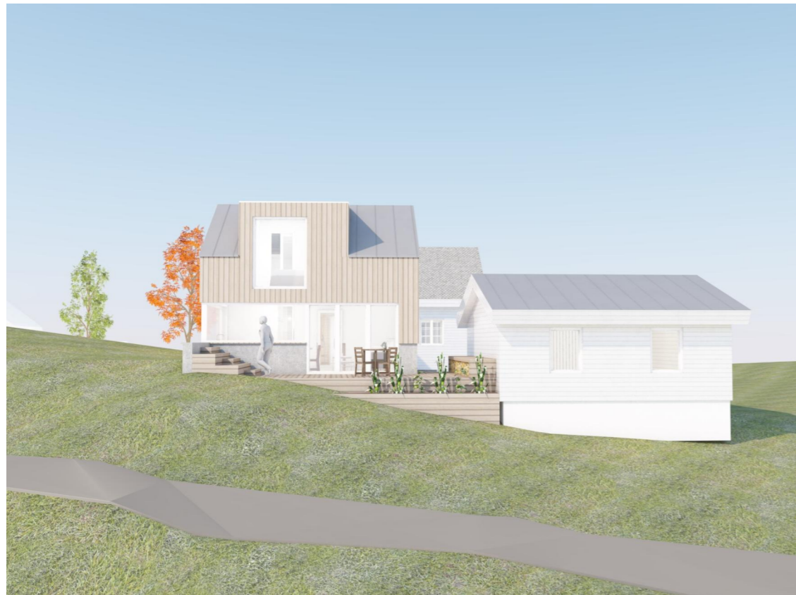
Ny fasade mot NØ