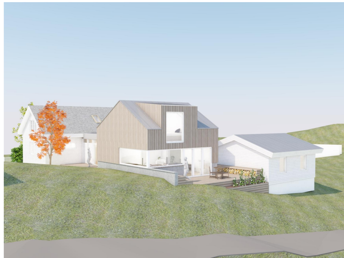
Ny fasade mot SØ