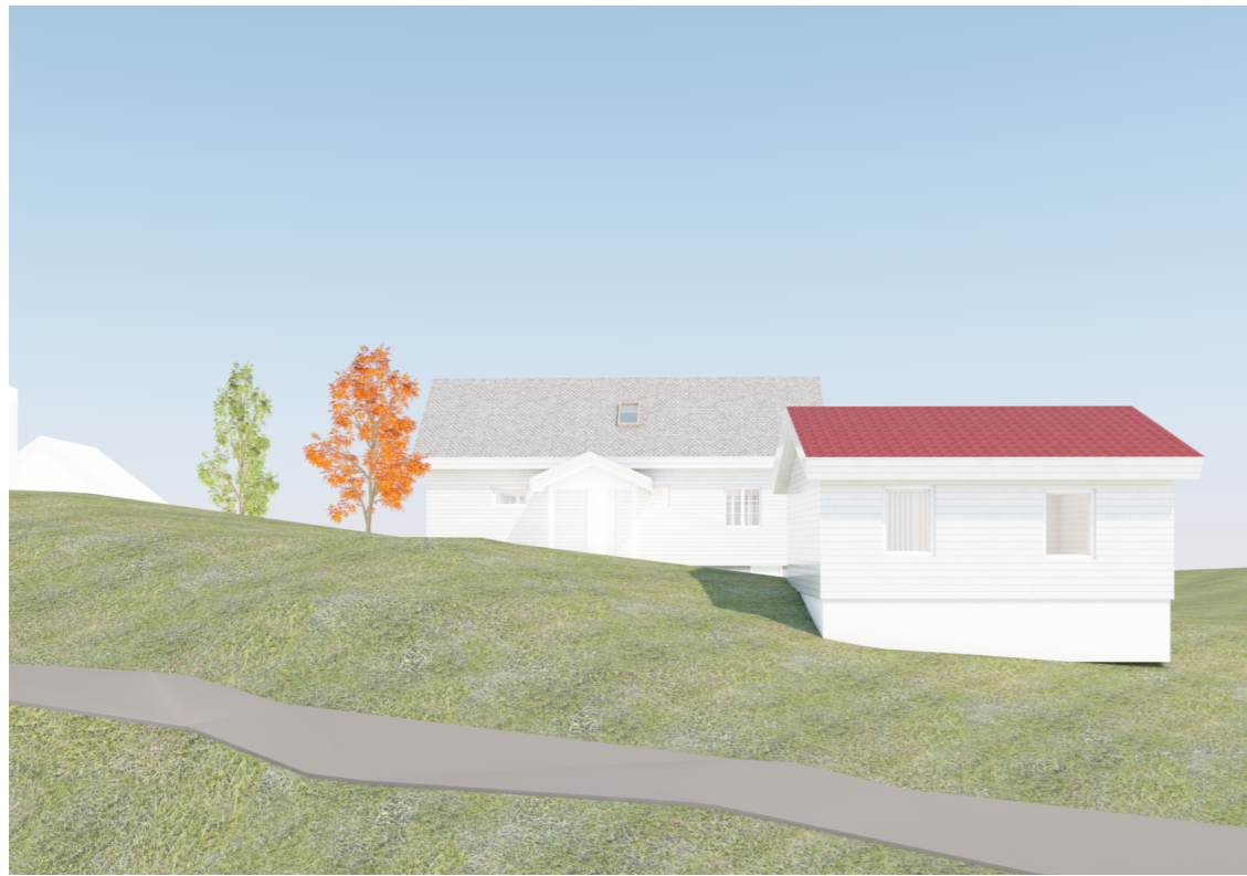
Eks fasade mot NØ