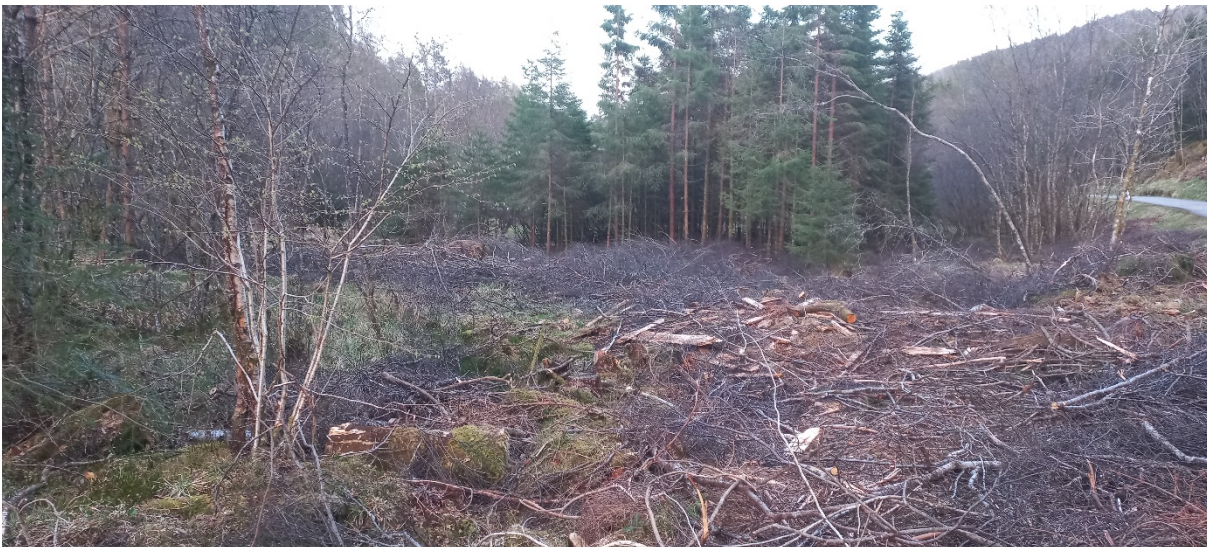
Fig. 2. Området sørsøraust for skogsvegen (biletet er teke frå skogsvegen). Bak grana midt på biletet ligg Grasdalsvatnet. Bekken frå dette vatnet og som renn mot Storavatnet, ligg i venstre biletkant. Offentleg veg ser vi til høgre.