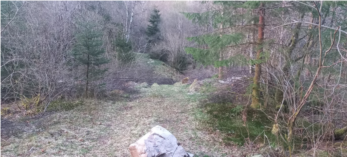
Fig. 1. Velteplassen er tenkt etablert på begge sider av eksisterande veg. Offentleg veg i bakkant av fotografen. I søkket eit stykke «inn» i biletet, kryssar vegen bekken som renn frå Grasdalsvatnet og ned til Storavatnet. Storavatnet er drikkevasskjelde for innbyggjarane i området.

Velteplassen gjer det mogleg å sikre god oppstilling til og rasjonell hogst av skog på eignedomen og er såleis i tråd med føremålet.