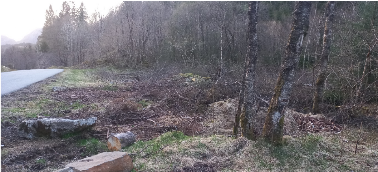
Fig. 3. Området nordnordvest for skogsvegen. Offentleg veg til venstre. Bekken frå Grasdalsvatnet ligg inne i skogen til høgre. Kommunen meiner det er betre å leggje veltteplasa i dette området samanlikna med området sørsørvest for skogsvegen.

Prinsippa i §§ 8-12 i naturmangfaldslova er lagt til grunn ved vurdering av vedtaket. Det er særleg lagt vekt på berekraftig bruk og vern av naturmangfald der den samla belastninga for økosystemet vert vurdert både på staden, men og i ein større samanheng. Kommunen har mellom anna søkt i naturbasen (via gardskart) og artsdatabanken). Det er ikkje gjort funn i traséen eller området i nærleiken. Men i kilden, nibio.no er området aust for skogsvegen registrert som djup myr – sjå fig. 4 nedanfor.