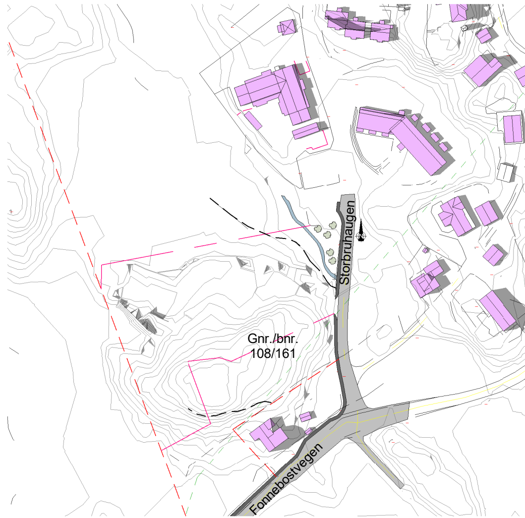
Solstudier 21. juni kl 18 - Før 1 : 2000