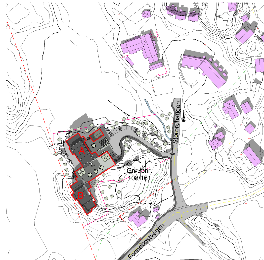
Solstudier 20. mars kl 15 - Etter 1 : 2000