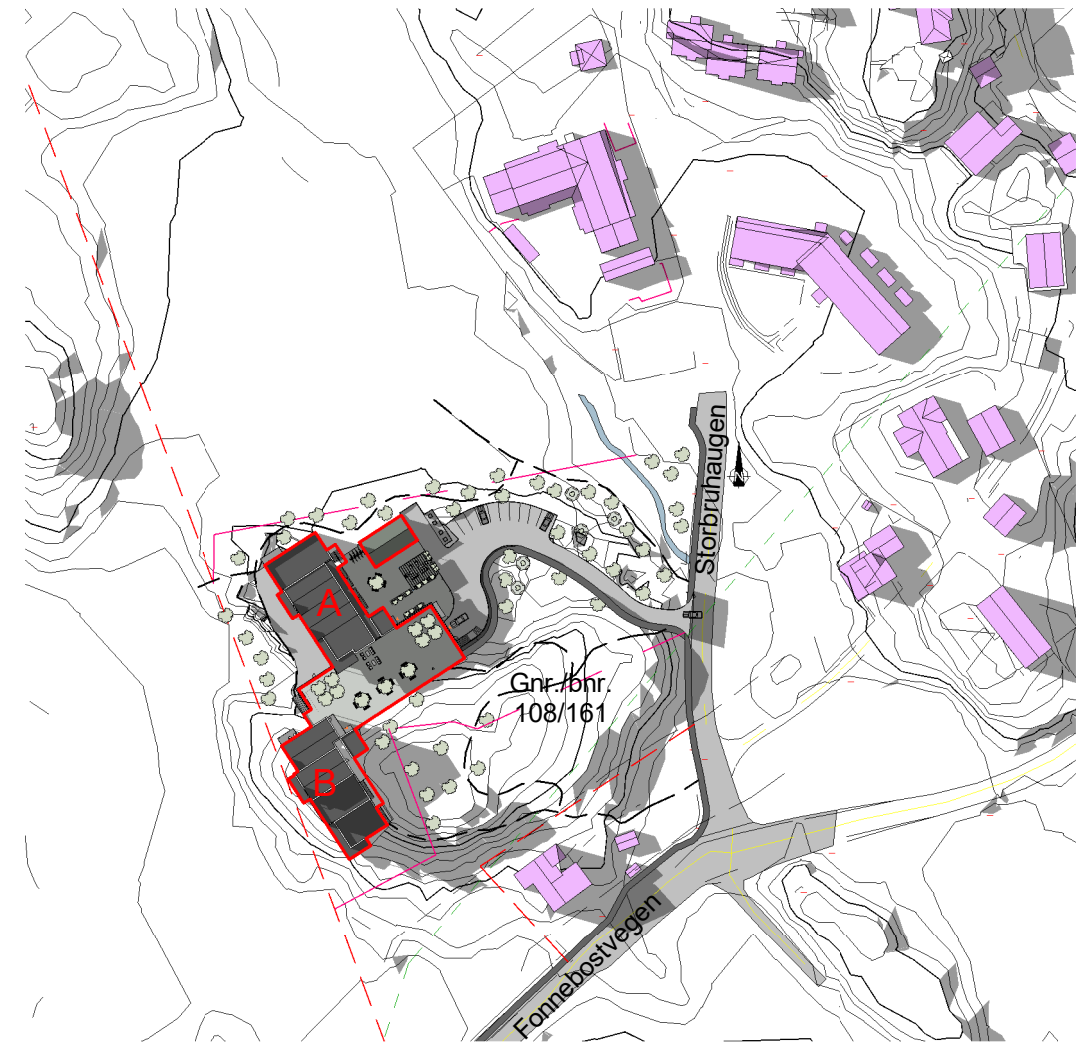
Solstudier 21. juni kl 20 - Etter 1 : 2000