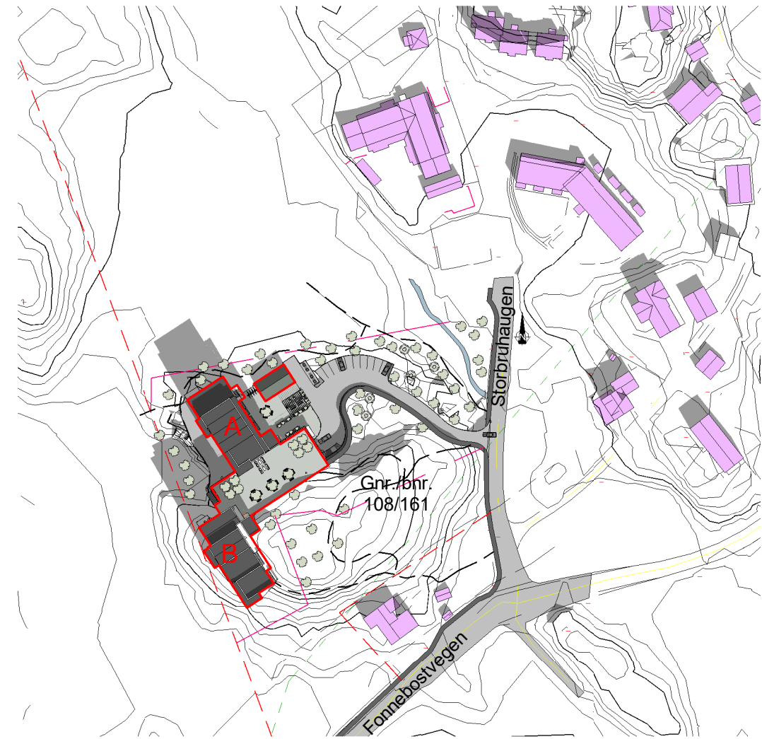
Solstudier 20. mars kl 12 - Etter 1 : 2000