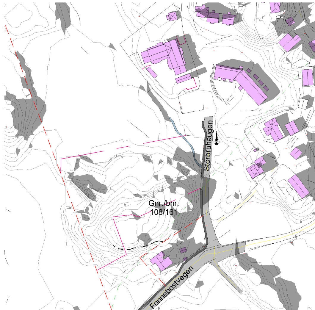
Solstudier 20. mars kl 18 - Før 1 : 2000