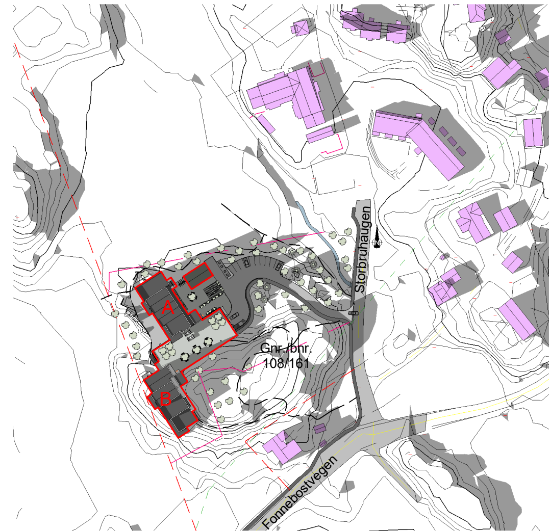
Solstudier 20. mars kl 18 - Etter 1 : 2000