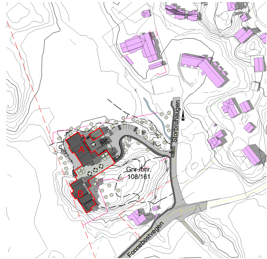
Solstudier 21. juni kl 18 - Etter 1 : 2000