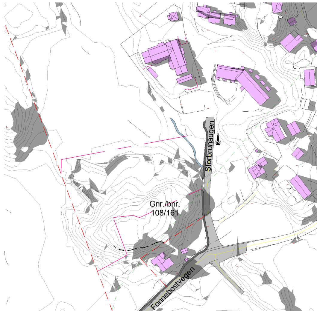
Solstudier 20. mai kl 20 - Før 1 : 2000