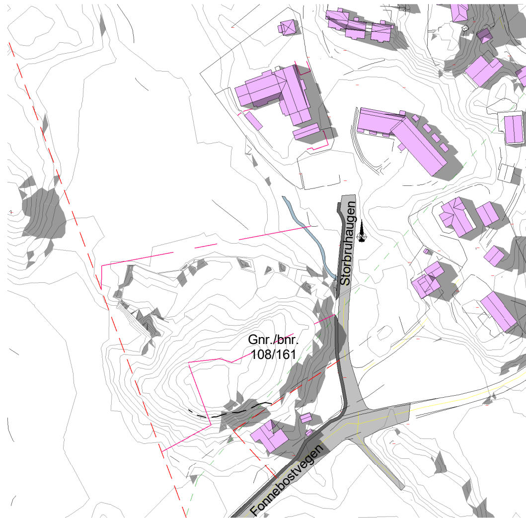
Solstudier 21. juni kl 20 - Før 1 : 2000