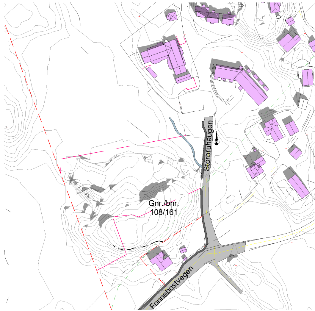
Solstudier 20. mars kl 12 - Før 1 : 2000