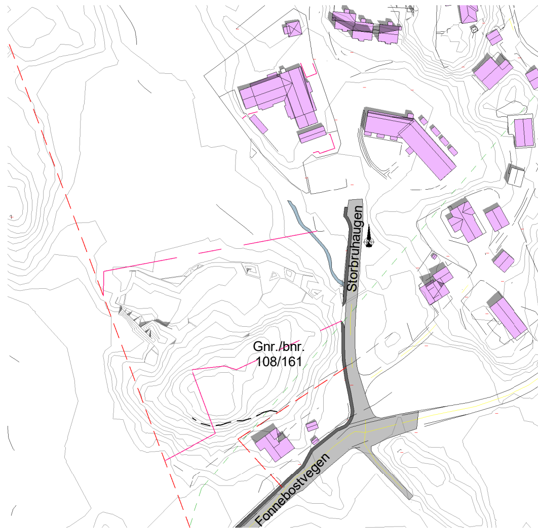
Solstudier 20. mai kl 12 - Før 1 : 2000