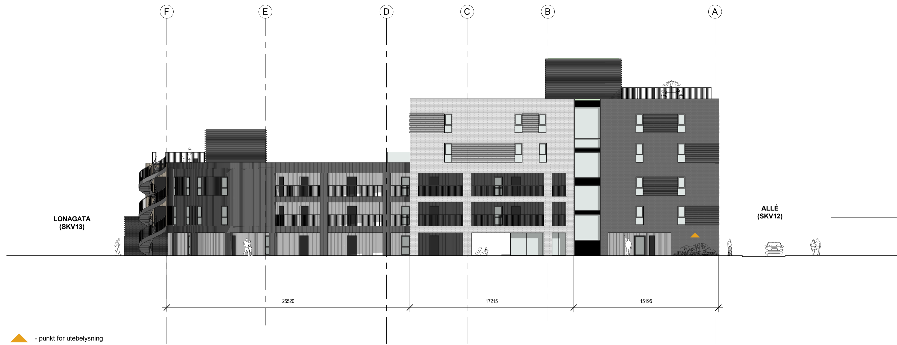
1 Fasade mot øst 1 : 200