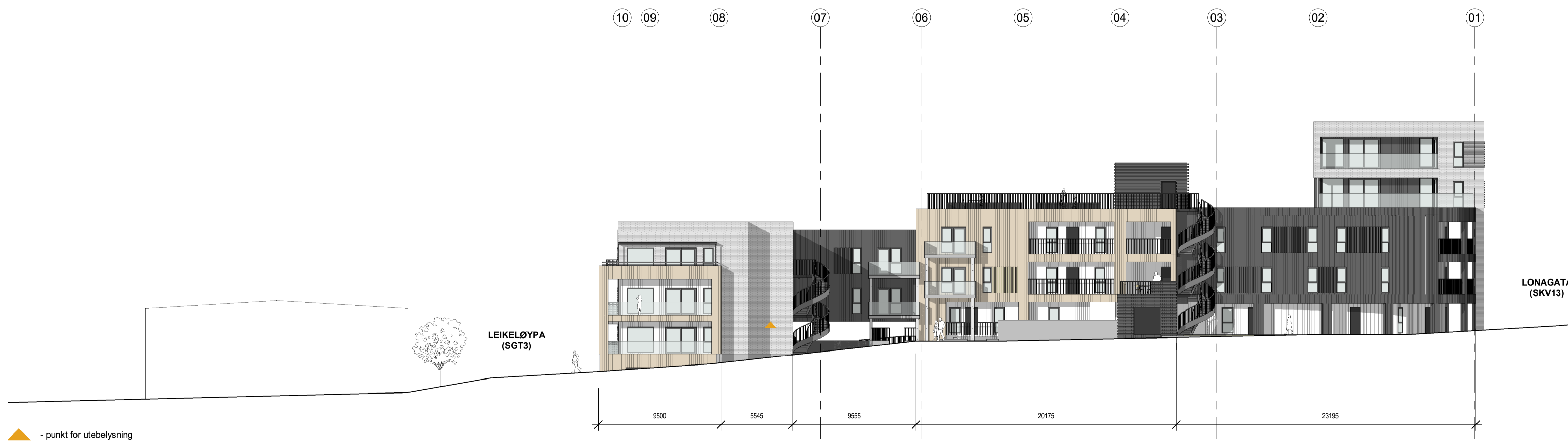
3 Fasade mot sør 1 : 200