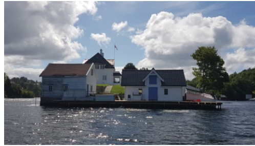
Naust med blå dør som skal bruksendrast