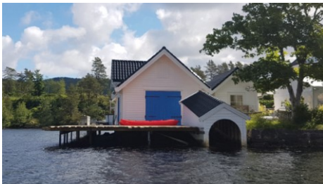
Treplattung langs naust