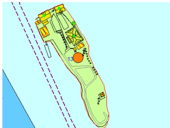
Kommunedelplan Knarvik- Alversund

Eigedomen ligg i uregulert område innanfor det som i kommunedelplanen for Knarvik – Alversund er avsett til landbruk, natur og friluftsføremål (LNF). Arealet i sjø er avsett til allmenn fleirbruk. Eigdommen ligg i den indre farleia og i eit område som kartlagt friluftsområde.