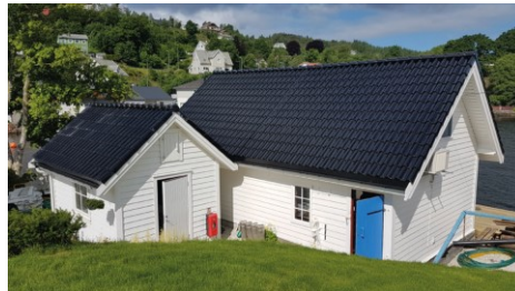
Naust og uthus som skal bruksendrast