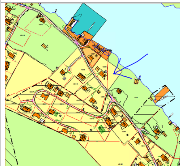
Figur 3 Kommunedelplan for Lindås