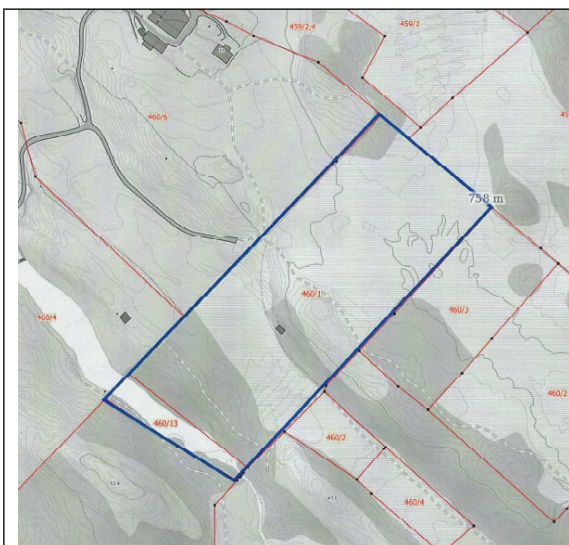
Figur 1 Situasjonsskart