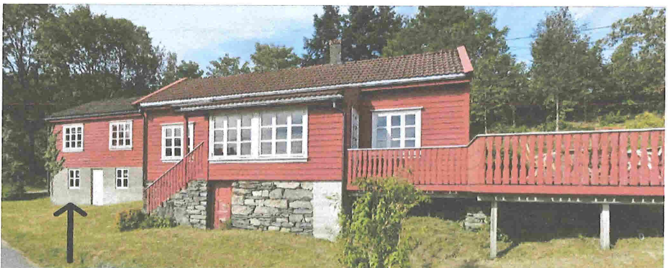
Tidligere strikkefabrikk kalt «Stricot»

Dataene hentes direkte fra Riksantikvarens SEFRAK-register.