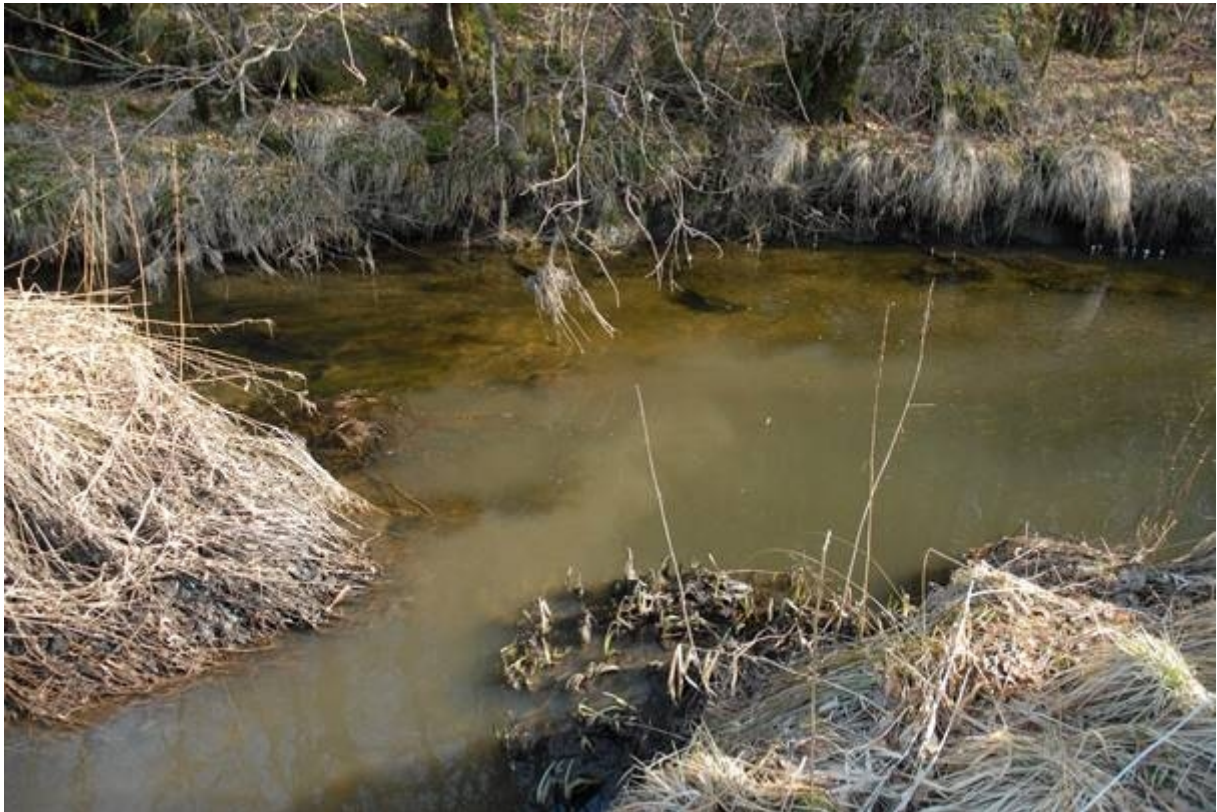
Avrenning av jord - og steinpartiklar til Mjåtveitelva 30. mars 2011. Sedimentering av slike partiklar er årsaka til massedød av elvemusling i 2011/2012 i Mjåtveitelva.

Nyleg gjorde Mjåtveitelvens foreining og lokale fridykkarar funn av fleire elvemuslingar, kanskje så mange som over 100 individ, ovanfor det som var antatt å vere vandringshinder i Mjåtveitelva. Denne delen av vassdraget har også tidlegare blitt gjennomført av biologar, men på grunn av djupt og ureina vatn vart det då ikkje observert elvemusling. Etter 2012 er det gjort eit fåtal funn av glochidielarvar (larvar av elvemusling) på fisk, som har vist at det har vore svært få elvemuslingar att. Denne attverande førekomsten av elvemusling i Mjåtveitelva vart vurdert som svært fåtalig og vurdert som kritisk trua.