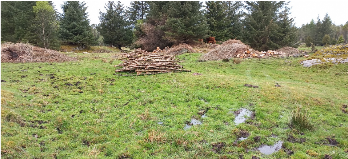
Fig. 4. ...før den skal inn på beitet. Området for den planlagde driftsbygningen ligg til høgre før veden og «rundkøyringa» vil gå om lag midt på biletet.