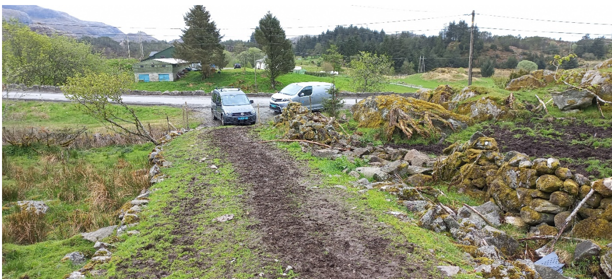
Fig. 2. Vegen på naboeigedomen (bnr. 16) må oppgraderast kraftig. Avkøyrsløype eventuelt endringsløype må vere på plass før arbeidet tek til.