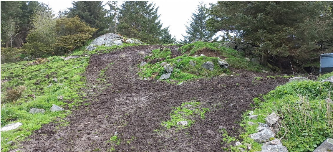
Fig. 3. Vegen skal opp ei lita bratt kneik...