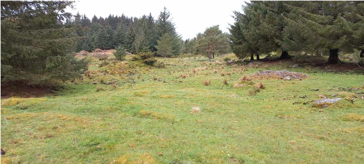
Fig. 6 ...før den endar i beitet om lag her (litt inn i biletet).