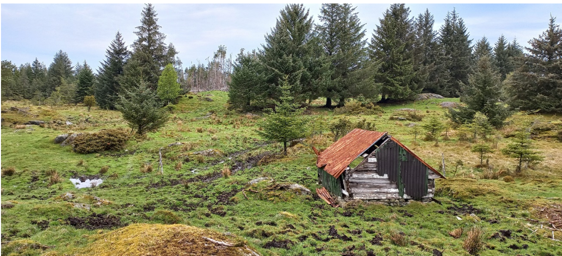
Fig. 5. Vidare austnord aust skal vegen gå om lag der hjulspora er....