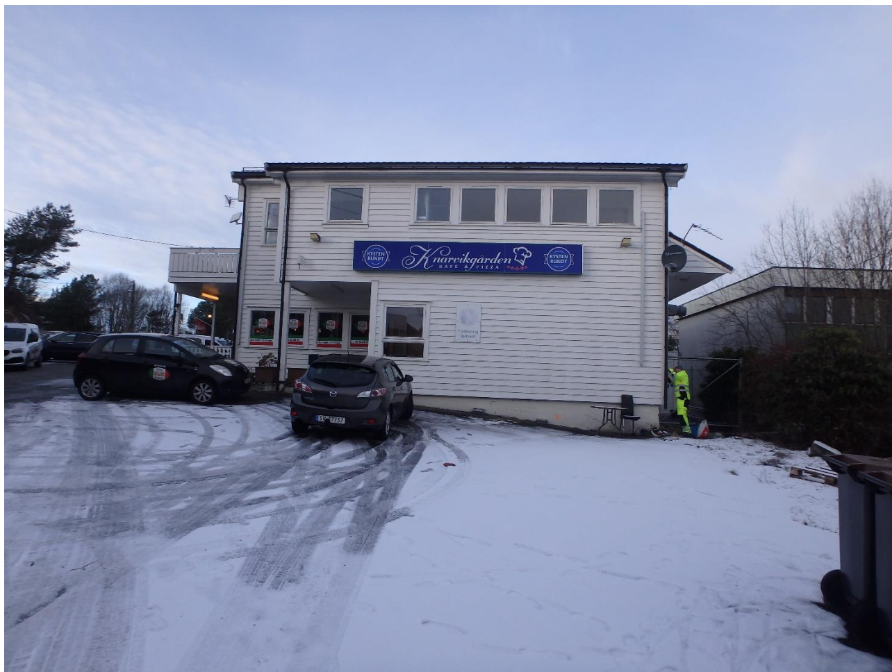
Figur 1 Bygningens endevegg mot syd