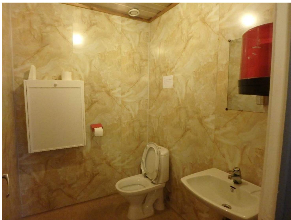
Figur 2 Baderomspanel i 2. etasje

Toalettene i restauranten i 2. etasje har baderomspanelplater på veggene. Disse platen er innsatt med det miljøskadelige stoffet pentaklorfenol. Det er totalt ca. 45 m 2 slike plater på toalettene.