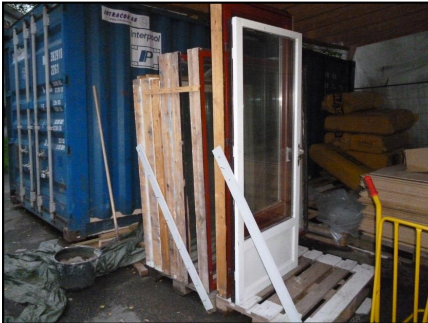
Figur 4: Slik kan vinduer og balkongdører klargjøres for transport.