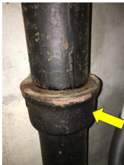
Figur 3 Gammelt avløpsrør av støpejern. Pilen viser plassering av eventuell asbestholdig tettemasse. Det er kun denne typen støpejernsrør vi kjenner til at det kan være brukt asbest i. Det er imidlertid ikke uvanlig at rørene er malt utenpå.

Om det er asbestmasse eller hamp i skjøten på slike rør er svært vanskelig å undersøke under en miljøkartlegging da det krever mye utstyr, kraft og dessuten ødelegger røret. Dersom det skal rives avløpsrør i støpejern anbefales entreprenøren å prøveta noen skjøter før oppstart, når vann og avløp er koblet fra, for å undersøke om rørskjøten inneholder asbest. Støpejernsrør er sprø, slik at det er mulig å slå i stykker skjøten med en slegge.