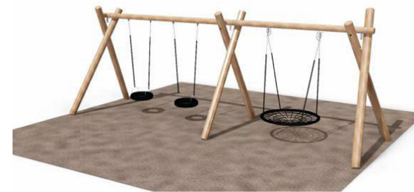
Lekeplass med ulike apparater for flere aldersgrupper og sykkelbane