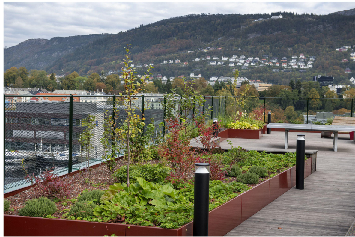
Plantekasser med kultur- og prydevekster på takhager