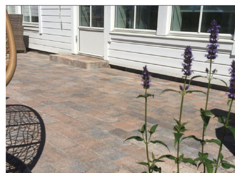
Beleggingstein i herregårdsstein i brunmix og gråmix