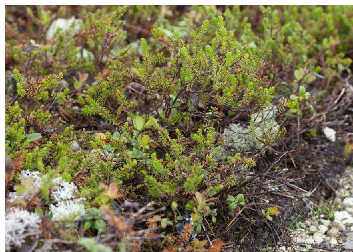
Lyngvegetasjon i gårdsrommet