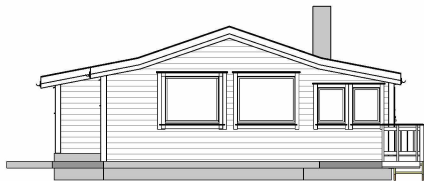
Fasade mot Sør