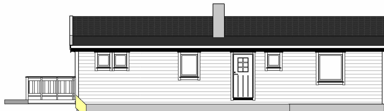
Fasade mot Øst