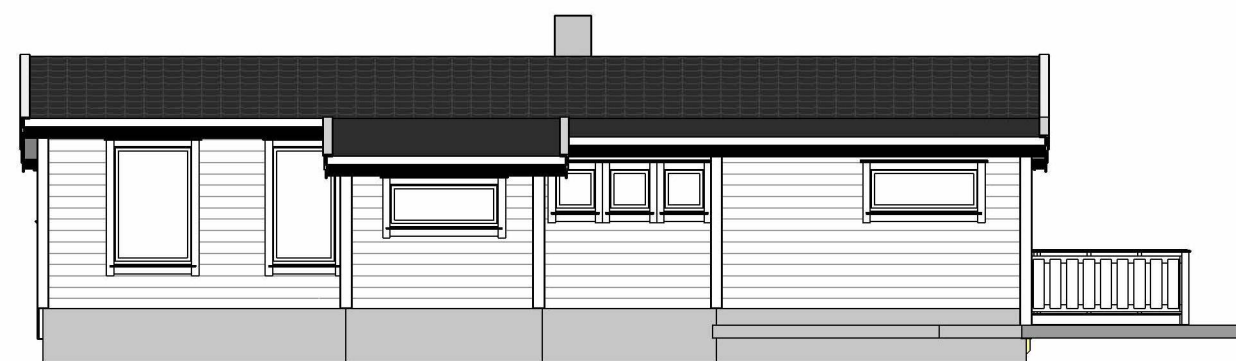
Fasade mot Vest