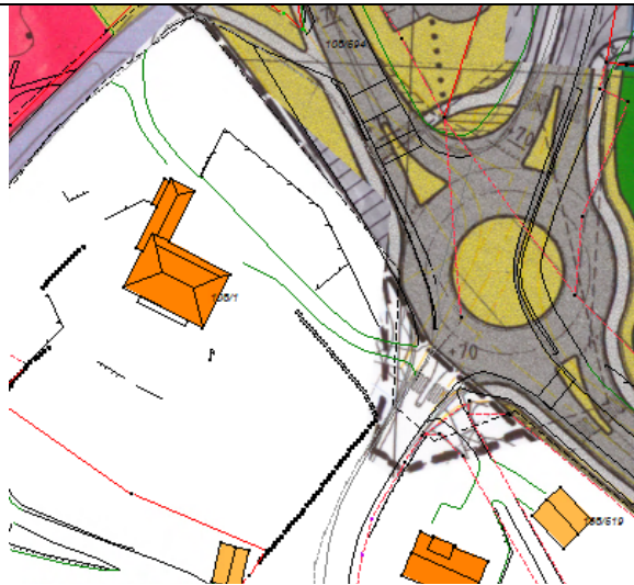
Figur 4 Reg.plan Riksveg 568 gjennom Lindås tettstad-2001