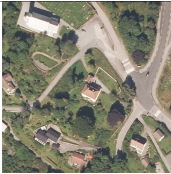
Figur 2 Ortofoto 2020