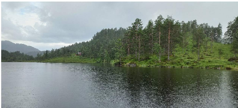
Fig. 2 under. Det er ikkje veg bort til hytta som vi ser litt til venstre i biletet.