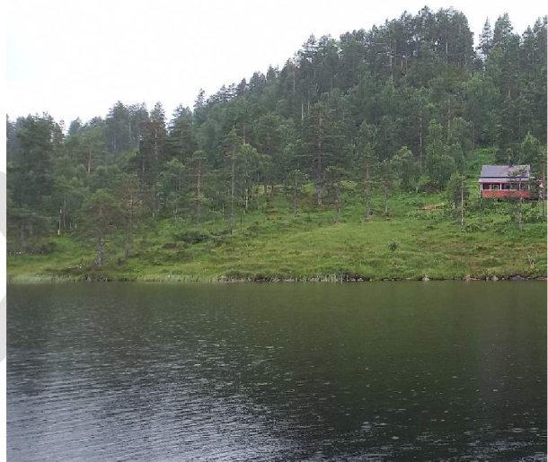
Fig. 3. I bakkant av hytta mot sørsørvest er det ein brattare knaus andsynes resten av om-rådet. Knausen er bestokka av furu.