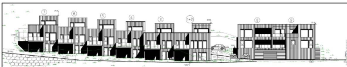
-Fasade sett fra sørvest

Rekkehus og tomannsbolig utføres med stående kledning i naturfarger (mørke nyanser av grått eller brunt) og vinduer med mørke karmar slik at byggene fremstår dempet i landskapet både ifht. nær- og fjernvirkning. Toppetasjen på rekkehusene er tilbaketrukket for å minimere høydeinntrykket fra strandsiden og for å delvis imøtekomme planens krav til terrassering. Topp kotehøyde på rekkehus går fra +25,3 på det laveste bygget og +27,3 på det høyeste. Topp kotehøyde på rekkehus ligger på +25,2.