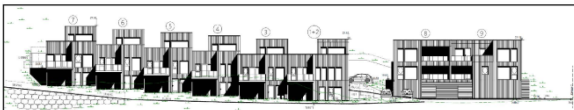
-Fasade sett fra sørvest

Rekkehus og tomannsbolig utføres med stående kledning i naturfarger (mørke nyanser av grått eller brunt) og vinduer med mørke karmar slik at byggene fremstår dempet i landskapet både ifht. nær- og fjernvirkning. Toppetasjen på rekkehusene er tilbaketrukket for å minimere høydeinntrykket fra strandsiden og for å delvis imøtekomme planens krav til terrassering. Topp kotehøyde på rekkehus går fra +25,3 på det laveste bygget og +27,3 på det høyeste. Topp kotehøyde på rekkehus ligger på +25,2.