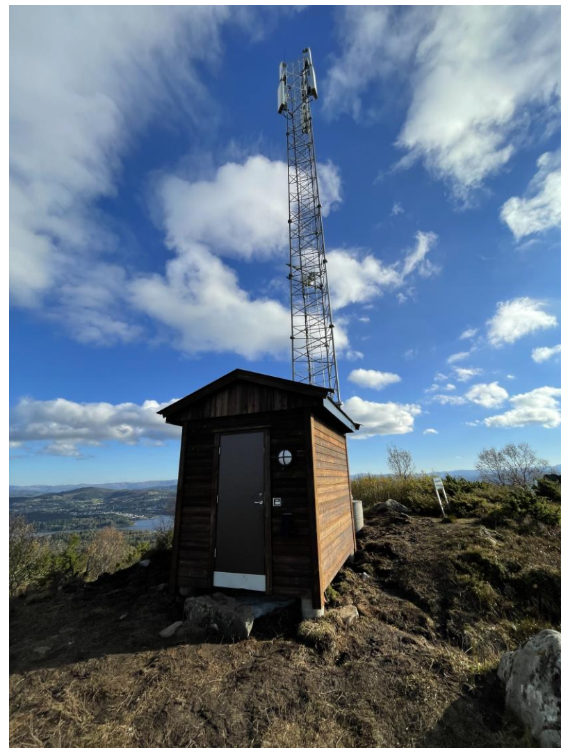
Bilde av tiltaket