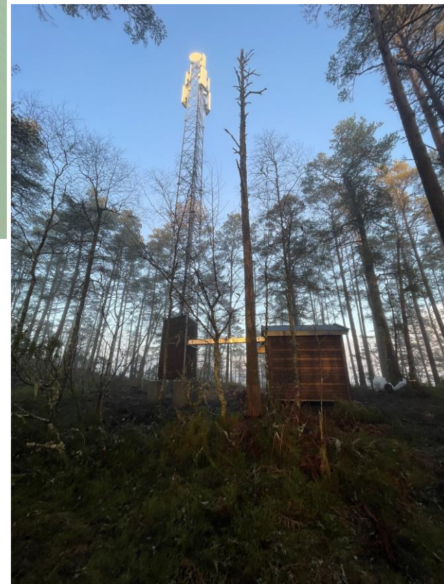
Bilde av tiltaket