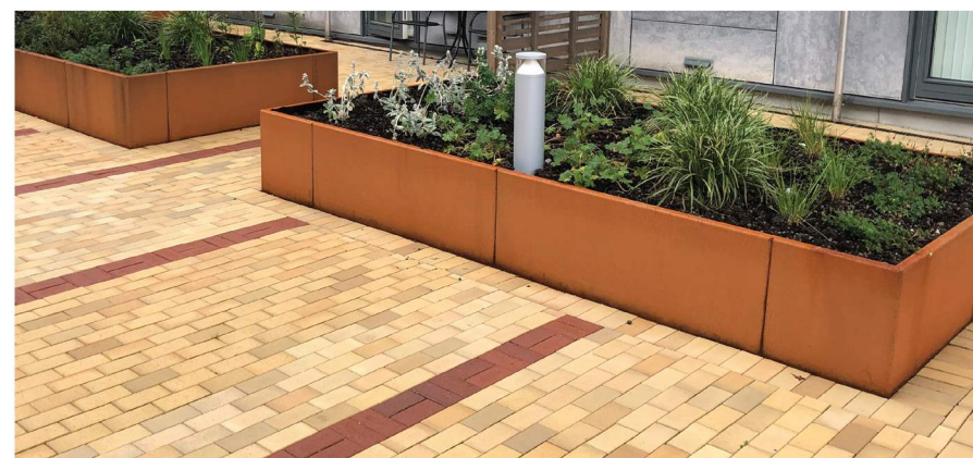
Fig.1: Marktegl og plantekasser av cortenstål Damsgårdssundet, Bergen

Valg av materialer er basert på å skape en innbydende møteplass i mange år inn i framtiden. Marktegl og cortenstål er robuste og varige materialer, som tåler tidens tann. For å unngå smitte av corten på dekke løses dette med en smal stripe med drenerende sand mellom kant og dekke. Kvalitetene på torget skal skape en følelse av urbant uteliv, og være et sted det er attraktivt og godt og oppholde seg.