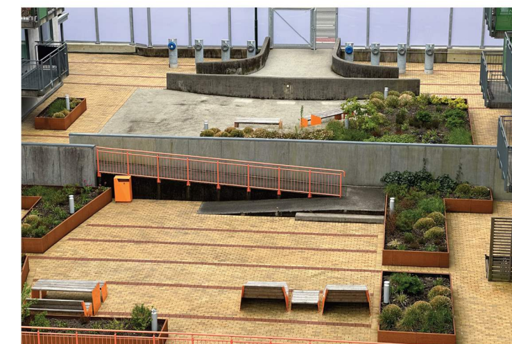
Fig.2: Marktegl og corten Damsgårdssundet, Bergen