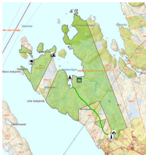
Kartutsnitt (B) – Io friluftsområde

BOF aksepterte tilbud frå AT Skog i mars 2023. Hogsten starta i april 2023. Andre grunneigarar i området har inngått tilsvarande avtalar med AT Skog.