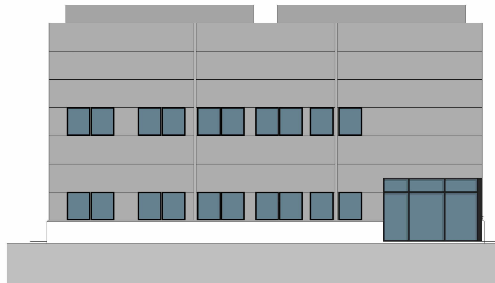
4 Øst 1 : 100