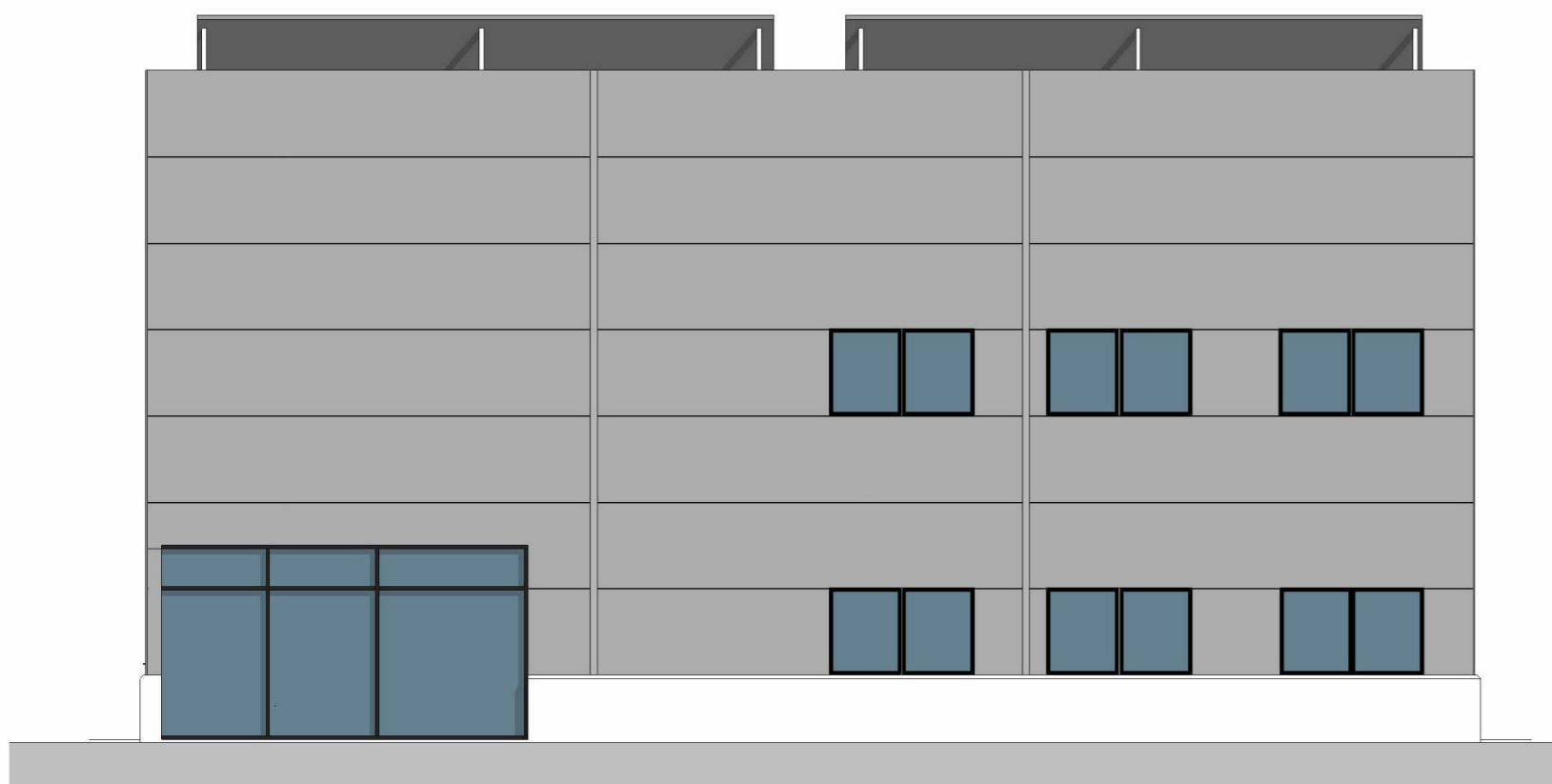
3 Vest 1 : 100