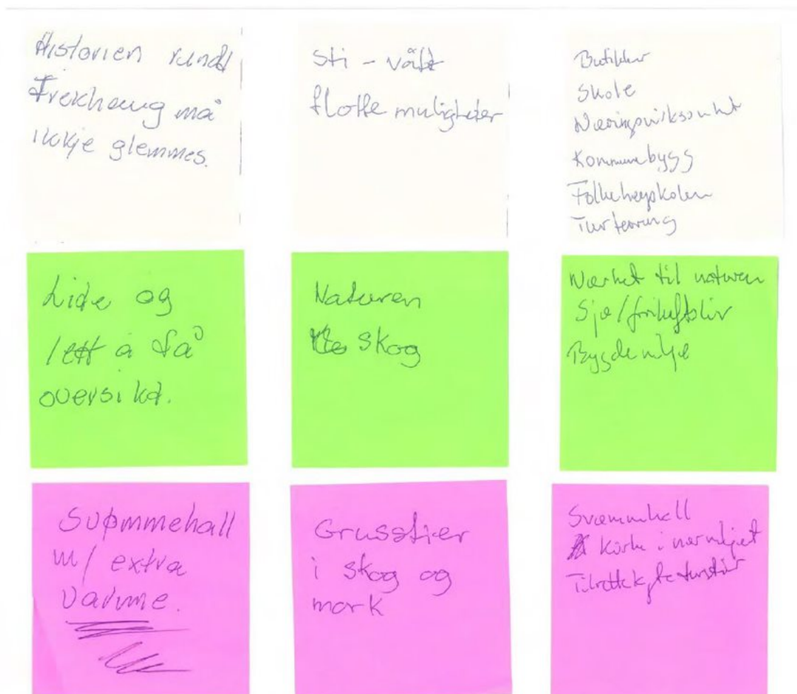
Figur 1-2: Aktiv deltaking under introduksjonsmøtet. Hvitt lapp representerer kva som kjenneteiknar Frekhaug. Grøn lapp er for kva kvalitet deltakarane liker best med Frekhaug og rosa lapp handlar om kva kvalitetar som manglar.