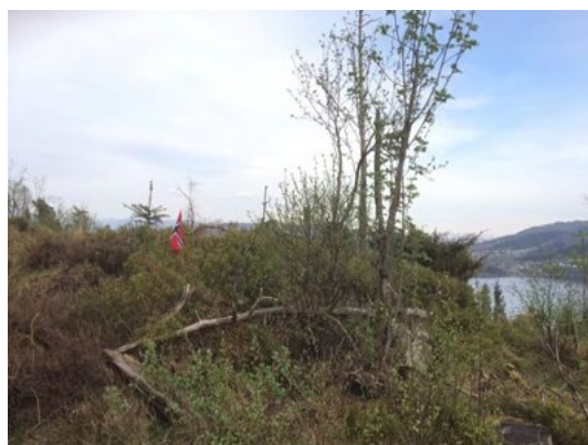
Figur 1-1 Tursamtaler med kaffepause i området. Deltakerne markerte viktige områder med flagg.

Alle innspel som kom inn i samband med introduksjonsmøtet og synfaring i planområdet er å finne i stikkordsform under.