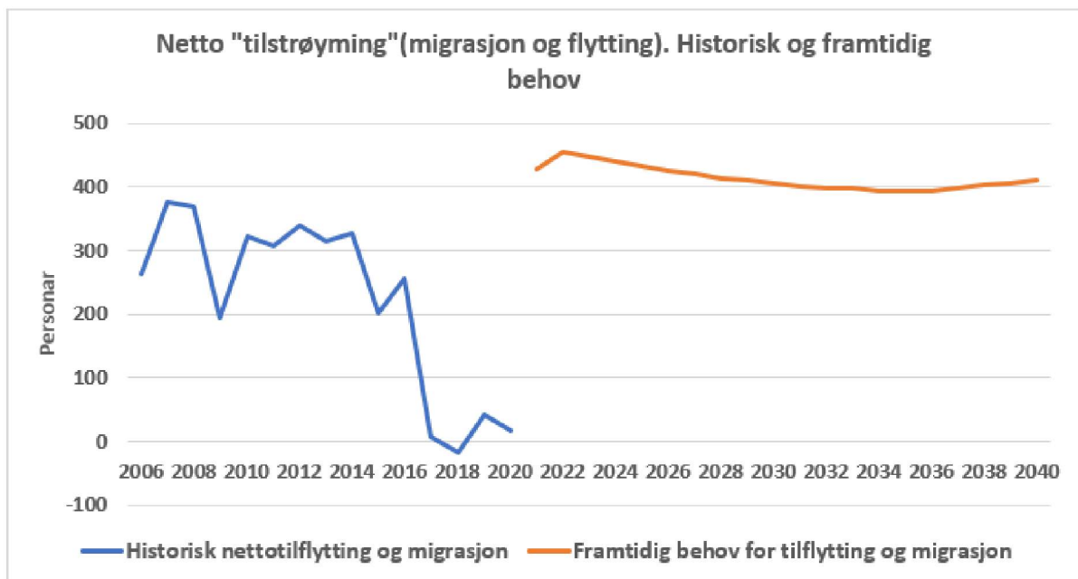
Figur 1: Netto flytting og migrasjon til Alver. Historiske tal, og framtidig behov dersom målet om 40 000 i 2040 skal nåast

Ei anna utfordring er sysselsetting til ein så stor befolkning. Viss yrkesdeltakinga og pendlarmønster er på same nivå som i dag, må talet på arbeidsplassar i Alver auke frå dagens 10.800 til 14.000 i 2040. I gjennomsnitt må talet arbeidsplassar auke med 1,4 prosent årleg. Dei siste ti åra har gjennomsnittsveksten for arbeidsplassar i Alver vore 0,5%. Eit mål på 40.000 i 2040 vil også skape utfordringar for kommunen sine tenester, og når det står som eit konkret mål i kommuneplanen sin samfunnsdel bør ein planlegge samfunnet og tenestene etter dette målet. Rådmannen anbefaler at det ikkje blir lagt inn eit måltal på 40.000 i 2040. I framtidsvisjonen er det lagt inn at vi vil ha vekst i folketal, arbeidsplassar og bedrifter.